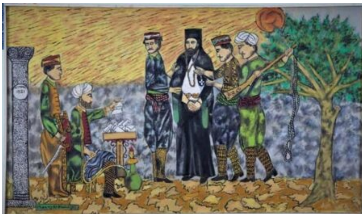
Μιχαήλ Κκάσιαλος, «Ο Αρχιεπίσκοπος Κυπριανός πριν τον απαγχονισμό του», ελαιογραφία σε ξύλο, Πανακοθήκη Πολιτιστικού Ιδρύματος Αρχιεπισκόπου Μακαρίου Γ', (Π.ΙΑΜ.581)

Όπως είναι γνωστό, στα χωριά της Μεσαορίας, και ειδικά στην Άσσια, τα τουρκικά στρατεύματα εφάρμοσαν με ωμότητα το σχέδιο εθνοκάθαρσης, με αποτέλεσμα τον θάνατο εκατοντάδων αμάχων σε ομαδικές εκτελέσεις, και τα ανείπωτα φρικτά βασανιστήρια σε βάρος γυναικοπαίδων.