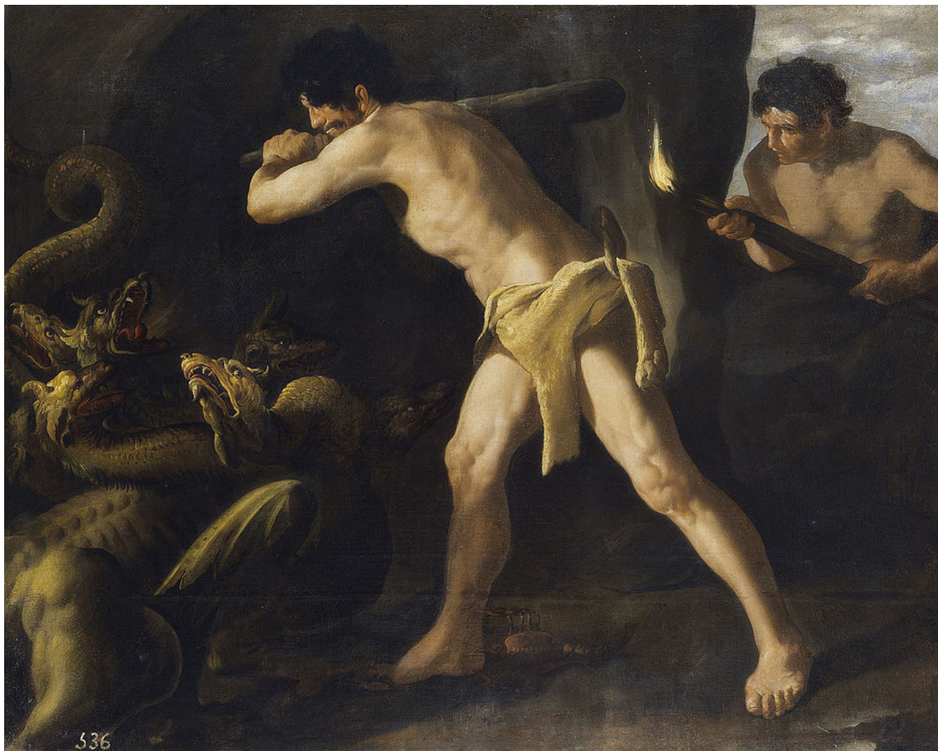
ε.Ο μύθος του Αυγεία: