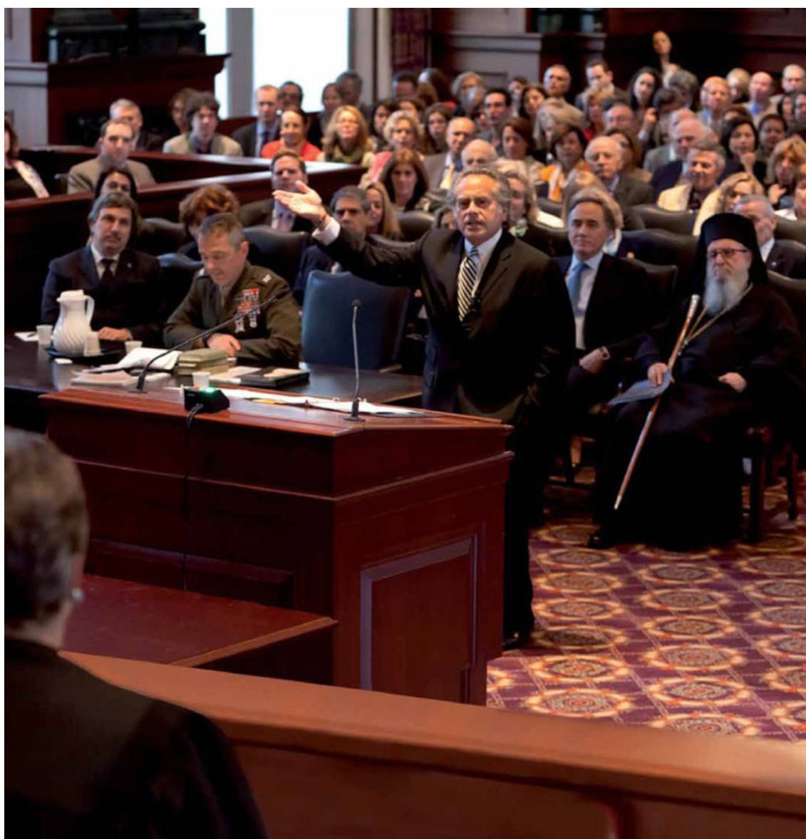
Μάιος 2011, η Δίκη του Σωκράτη στο Ομοσπονδιακό Δικαστήριο της Νέας Υόρκης

Περίπου 2.500 χρόνια αργότερα –σήμερα– διακεκριμένοι ανώτατοι δικαστές και νομικοί από την Ευρώπη και τις Η.Π.Α. συγκεντρώνονται στην Κεντρική Σκηνή της Στέγης Γραμμάτων & Τεχνών για να επαναλάβουν την ιστορική δίκη του Σωκράτη. Βασισμένη σε ιστορικές και σύγχρονες πηγές και μελέτες αλλά συγχρόνως προσαρμοσμένη στο κλίμα των σημερινών δημοσίων συζητήσεων, η εκδήλωση θα διερευνήσει τα ευρεία πολιτικά και φιλοσοφικά ζητήματα που διέπουν τις κατηγορίες κατά του Σωκράτη και κυρίως θα δώσει το έναυσμα για αναστοχασμό σημαντικών σημερινών ζητημάτων. Οι δικαστές αλλά και το κοινό θα κληθούν να απαντήσουν αν ο Σωκράτης ήταν τελικά αθώος ή ένοχος.