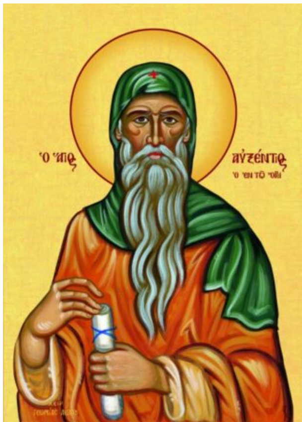
Ὁσιος Αυξέντιος ὁ ἐν τῷ ὄρει Ἰούτιον ἢ Γιούτι τῆς Καρπασίας Κύπρου.