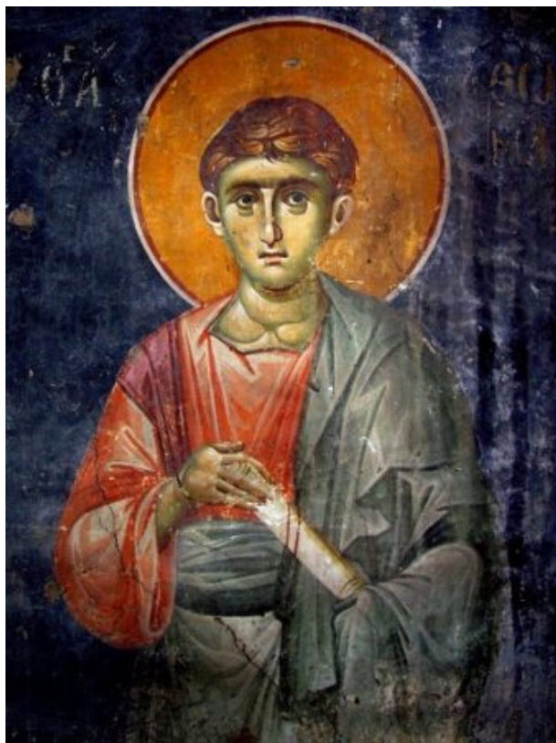
Απόστολος Θωμάς. Τοιχογραφία 13ος αι. Έργο Μανουήλ Πανσέληνου στον Ιερό Ναό του Πρωτάτου Αγίου Όρους.