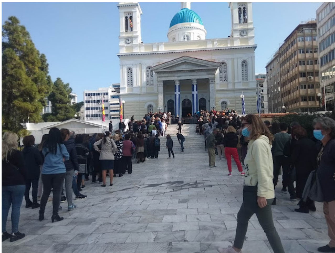
Νοέμβριος 2022 - Η Αγία Ζώνη στον Άγιο Νικόλαο Πειραιά. Πλήθη κόσμου αναμένουν να προσκυνήσουν.