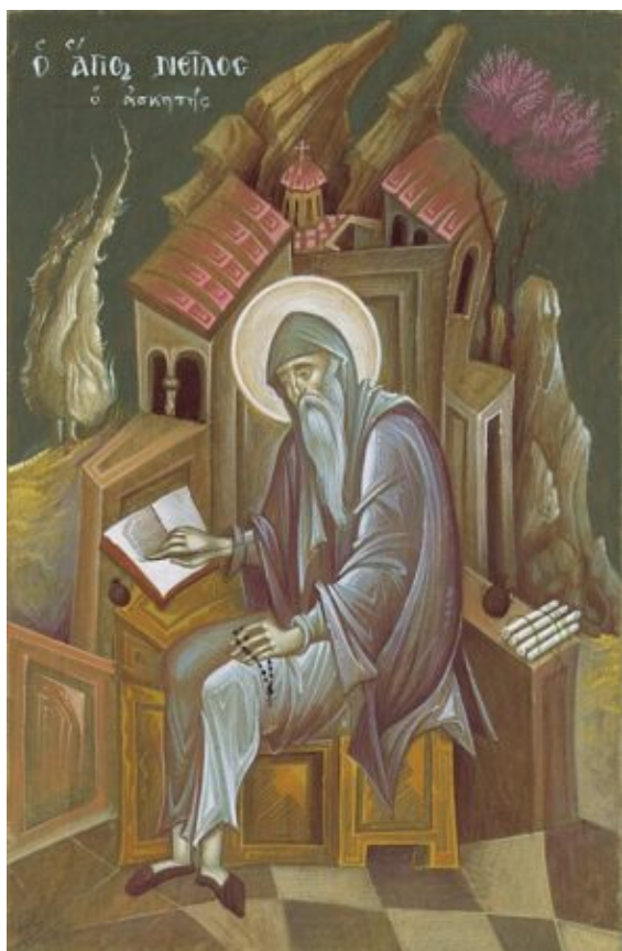
Άγιος Νείλος ο Ασκητής.