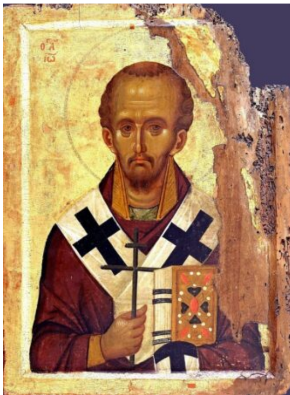
Άγιος Ιωάννης Χρυσόστομος, (13ος αιώνας) Ιερά Μεγίστη Μονή Βατοπαιδίου Αγίου Όρους.