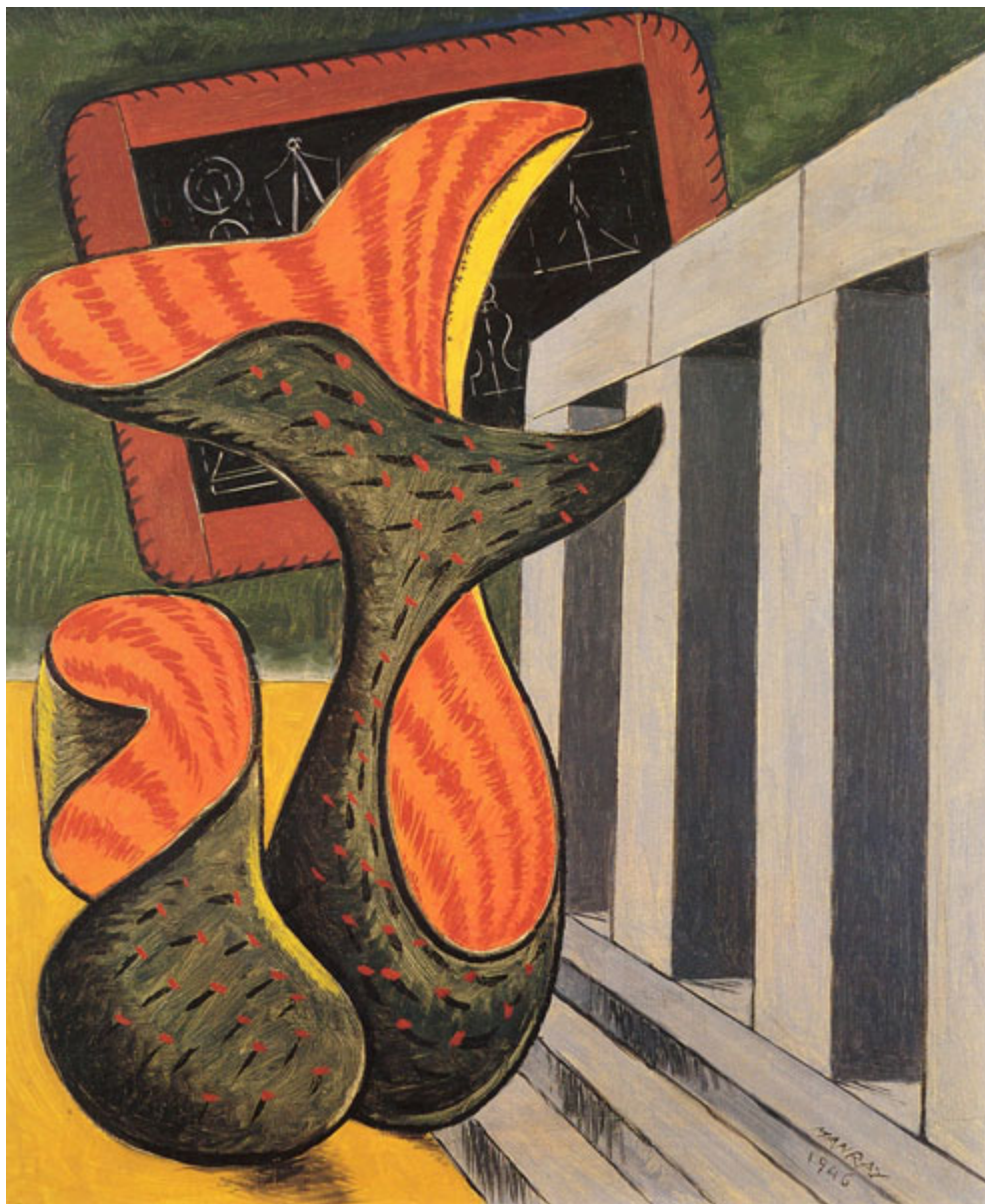
Το φυτό της ερήμου, Man Ray