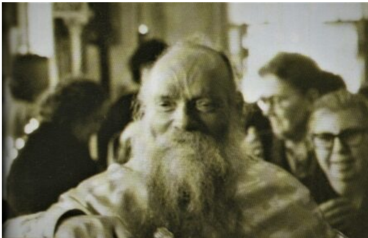
Άγιος Ευμένιος (Σαριδάκις) 1931-1999.