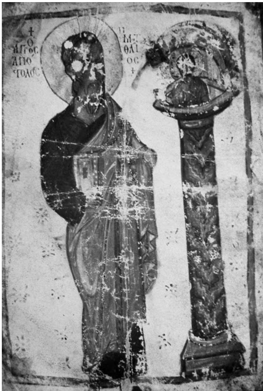
ο Ματθαίος απεικονίζεται όρθιος δίπλα από φιάλη που βγάξει νερό

Σε χειρόγραφο του 12ου αι. με τις Ομιλίες του Ι. Χρυσοστόμου (Ambros 172 sup., fol. 263v) το ειλητάριο του ιεράρχη μετατρέπεται σε ποταμό, Πηγή ζωής ή Σοφίας, όπου έρχονται να ξεδιψάσουν κληρικοί και μοναχοί. Το νόημα είναι ότι μόνο στην Εκκλησία μπορούν οι πιστοί να λάβουν τη χάρη της διδασκαλίας του Λόγου του Θεού με τη συμμετοχή τους στα ιερά μυστήρια.