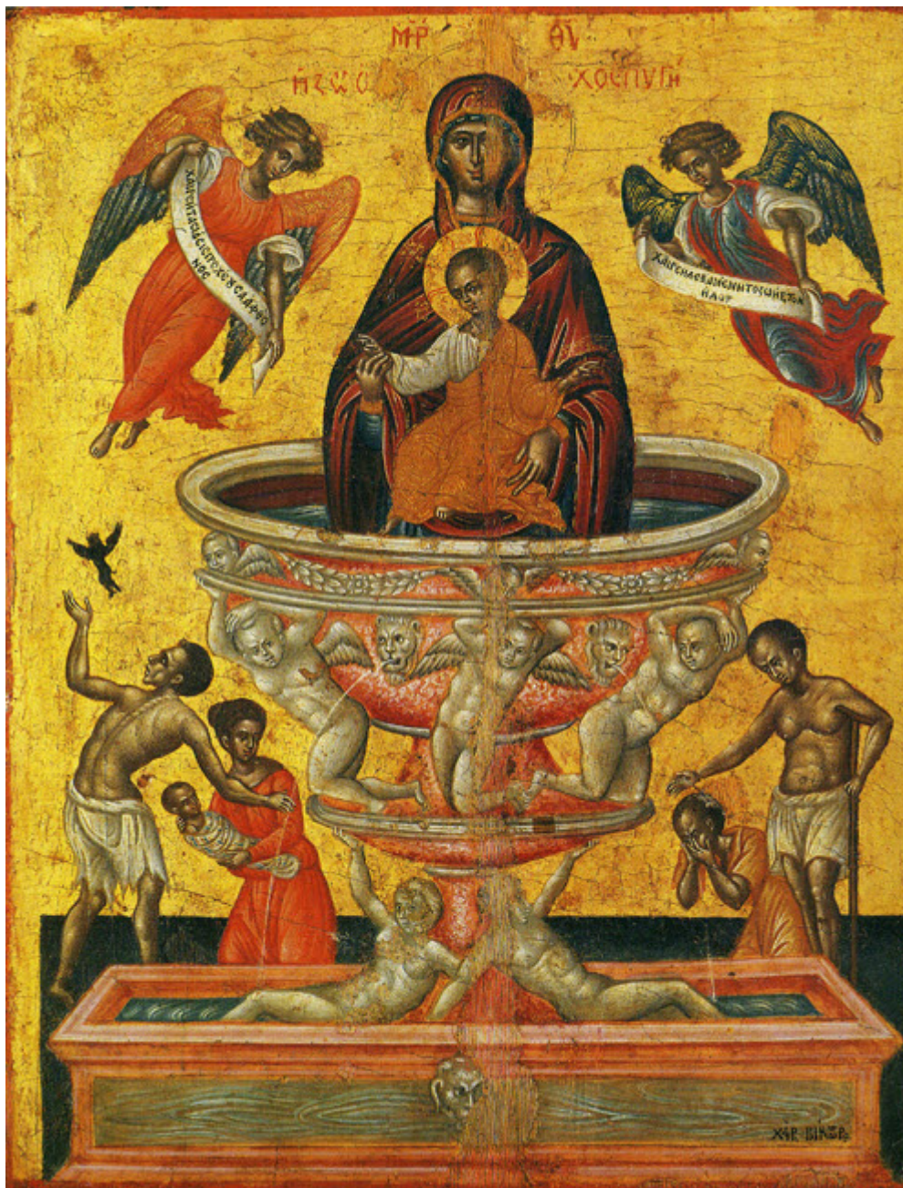
Παναγίας με το Βρέφος

Όμως η έννοια της Παναγίας Ζωοδόχου Πηγής σχετίζεται ιδιαίτερα με τη σκηνή του Ευαγγελισμού. Στον Αη-Γιαννάκη του Μυστρά , του 15ου αιώνα, ο Γαβριήλ και η Θεοτόκος πλαισιώνουν την Ζωοδόχο πηγή μέσα σε φιάλη.