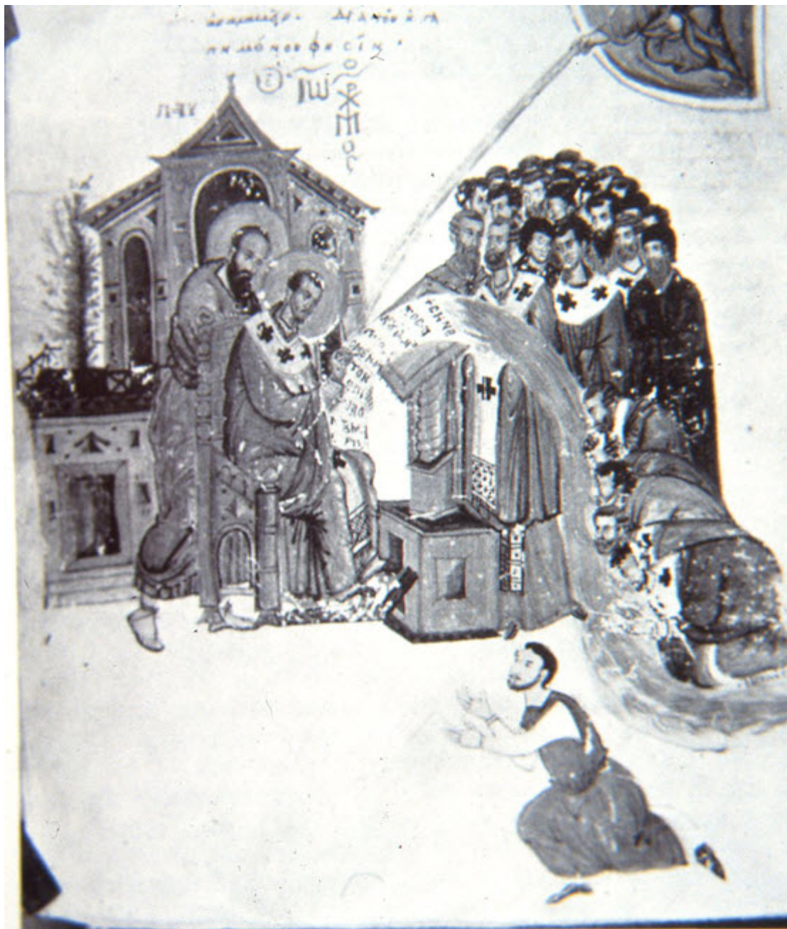
Ομιλίες του Ι. Χρυσοστόμου

Η έννοια της Πηγής της Ζωής και της Σοφίας αποδίδεται, όπως είπαμε, ιδιαίτερα στην Παναγία, γιατί από τους πρώτους αιώνες οι θεολόγοι συσχετίζουν το «καθαρτήριο υδωρ» με τα σπλάγχνα της Παρθένου. Στην Κωνσταντινούπολη, μάλιστα, από τον 4ο αιώνα, υπήρχε θαυματουργικό αγίασμα και εκκλησία της Παναγίας Ζωοδόχου Πηγής, της οποίας η λατρεία γνώρισε ιδιαίτερη έξαρση το 14ο αιώνα.