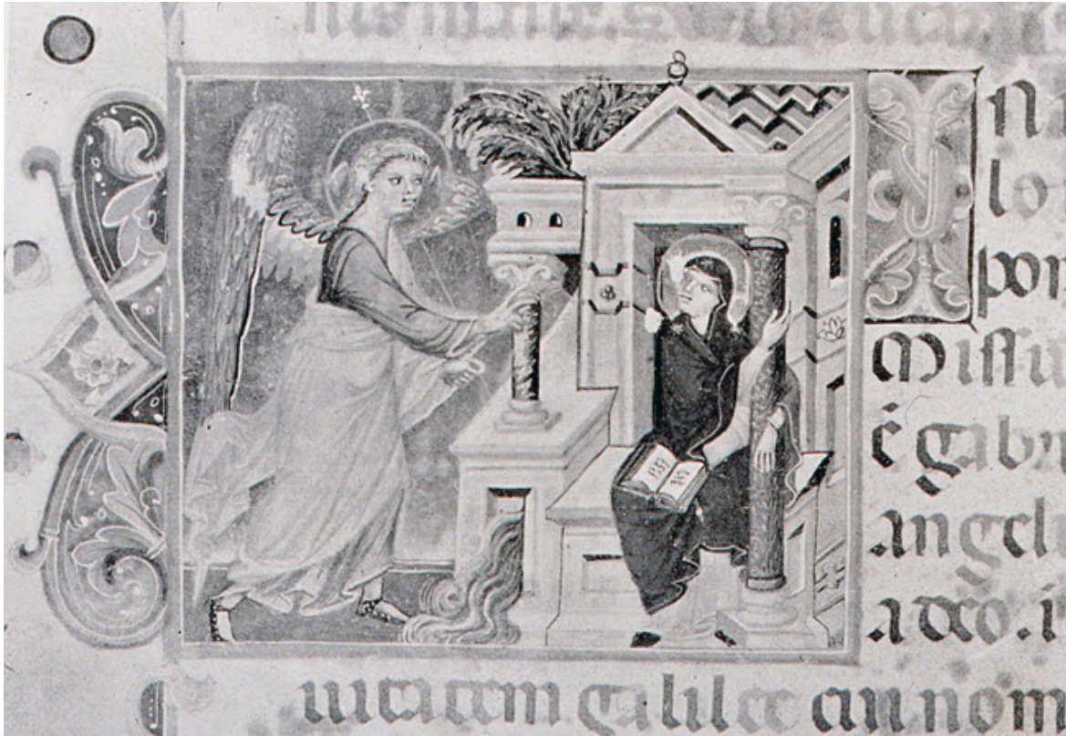
βενετσιάνικη μικρογραφία του 14ου αιώνα

Με τη συμβολική της αξία η πηγή παρεισφρύει καμιά φορά και στον κανονικό Ευαγγελισμό. Ενδεικτική είναι μια δυτική, βενετσιάνικη μικρογραφία του 14ου αιώνα . Το νερό πηγάζει με φόρα από μια αρχιτεκτονική κατασκευή δίπλα από την Παναγία.