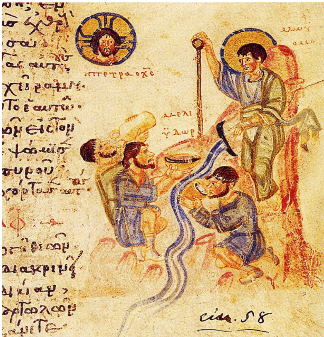
κώδ. Παντοκράτορος 61, φολ. 114α (857-865)

Κατά το Μεσαίωνα, κυρίως σε καρολίνια ευαγγελιστάρια, το θέμα της Ζωοδόχου Πηγής, αποδίδεται με το αρχιτεκτονικό σχήμα ενός βαπτιστηρίου ή του Παναγίου τάφου που ερμηνεύεται ως Ζωοδόχος Πηγή.