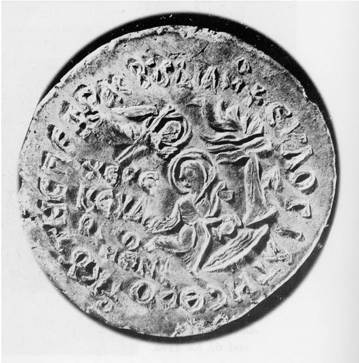
πήλινο μετάλλιο του 6ου αιώνα

Παρθένος σπεύδει στο ποτάμι, να αντλήσει νερό στα ριζά ενός δένδρου.