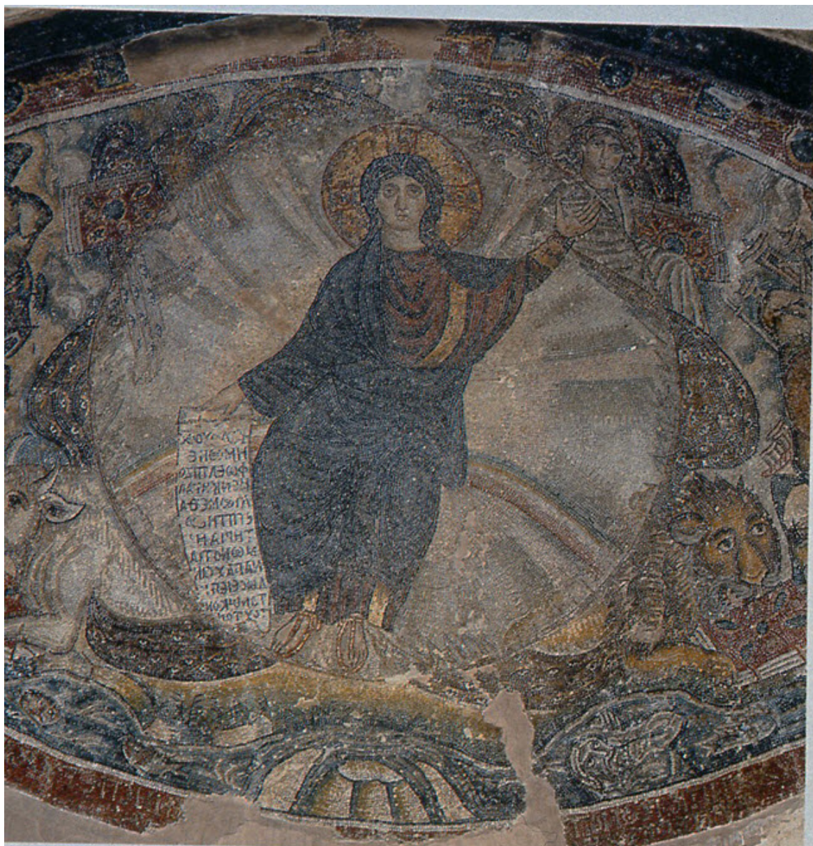
Αψίδα του καθολικού της Μονής Όσίου Δαυίδ στη Θεσσαλονίκη

Στην αψίδα της Αγίας Πραξέδης στη Ρώμη (9ο αι.) ο Παντοκράτορας αιωρείται πάνω από την κρυστάλλινη θάλασσα και τον Ιορδάνη, ενώ στην κάτω ζώνη, από τον θρόνο του αρνίου εκπηγάζει « ποταμός Ζωής ».