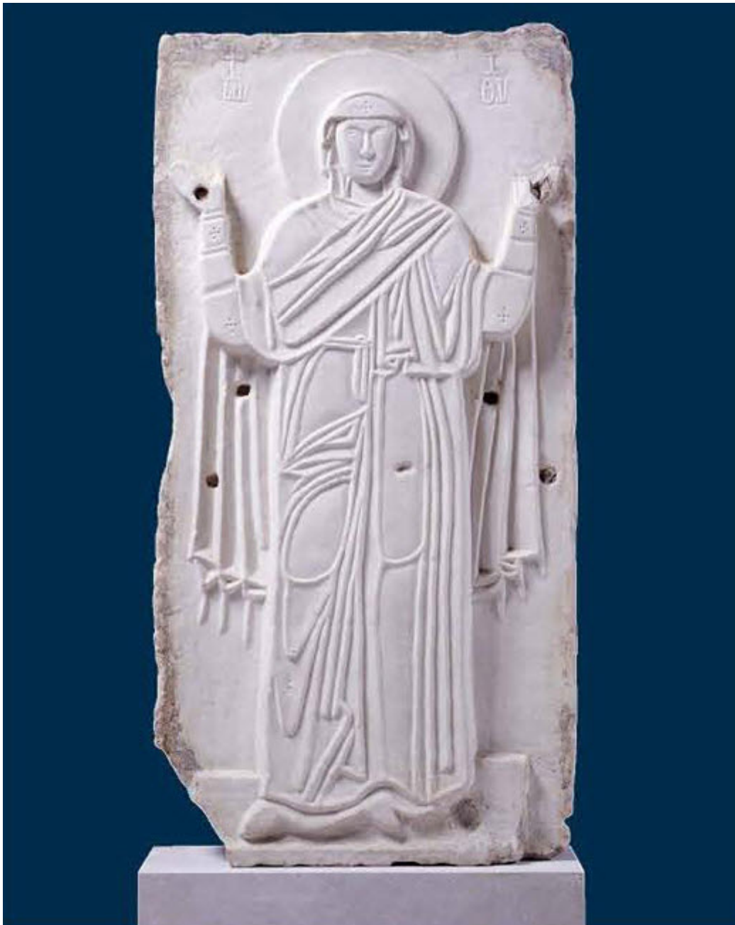
ανάγλυφες εικόνες της Θεοτόκου

Τον 14ο αιώνα, στη Μονή της Χώρας στην Κωνσταντινούπολη, η Παναγία Ζωοδόχος Πηγή παριστάνεται δεομένη σε προτομή πάνω από λεκάνη.