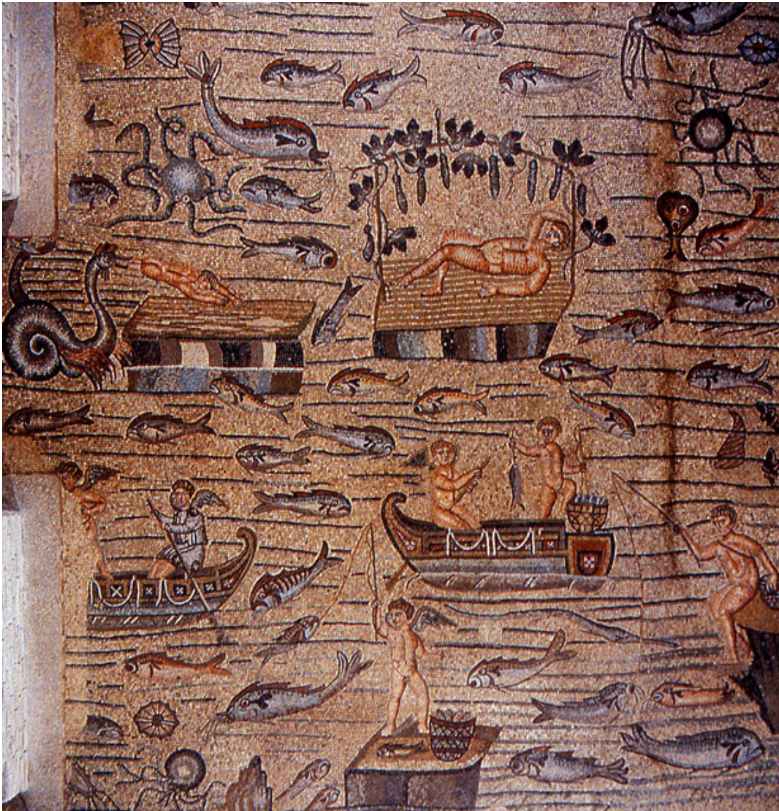
παράσταση του υδάτινου τοπίου

φαντασία εικόνες που θυμίζουνε εξωτικά τοπία από το Νείλο, γνωστές ως «νειλωτικά τοπία», κατά τους παλαιοχριστιανικούς χρόνους είναι διαδεδομένες γιατί υπαινίσσονταν την αθανασία της ζωής στον Παράδεισο.