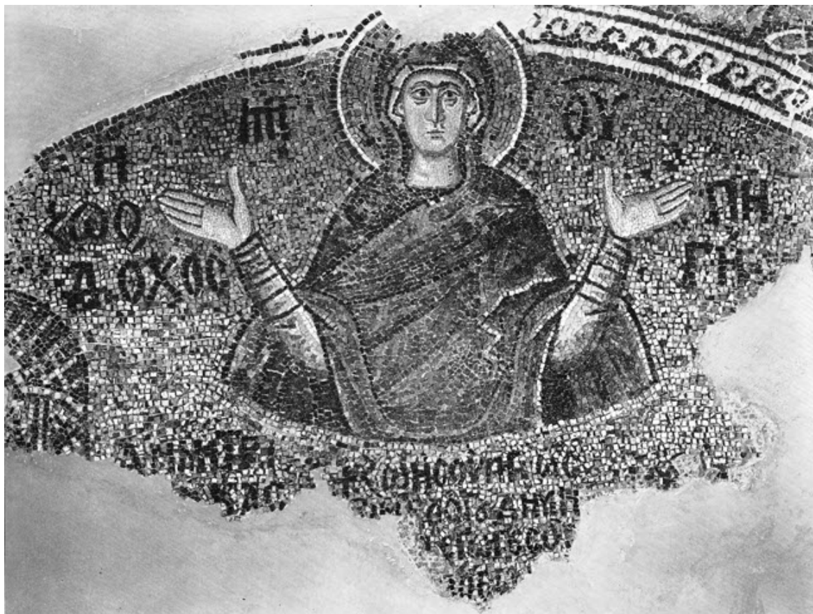
Μονή της Χώρας

Σε μεταγενέστερη εποχή, για το ίδιο θέμα, επικρατεί ο τύπος της Παναγίας με το Βρέφος πάνω από λεκάνη με υποστάτη που βγαίνει μέσα από δεξαμενή.