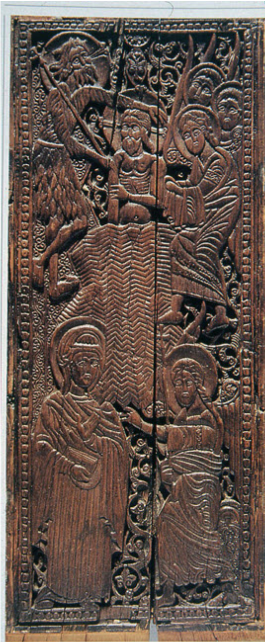
θύρα του ναού Al-Mu'allaka στο Κάιρο.

Ένα παράδειγμα εξαιρετικά ενδιαφέρον βρίσκεται στους Αγίους Αποστόλους στο Περαχωριό της Κύπρου (1160-80).