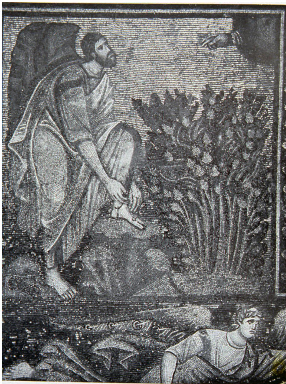
ψηφιδωτό με το Όραμα της βάτου

Επιπλέον, σε κάποιες δοκούς από την οροφή της βασιλικής που χρονολογούνται από την ίδια εποχή (548-565) ο ανάγλυφος διάκοσμος επαναλαμβάνει στοιχεία από τη χλωρίδα και την πανίδα του Νείλου και πλοιάρια με κωπηλάτες.