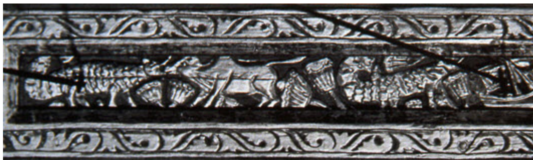
ο ανάγλυφος διάκοσμος

Το κείμενο αυτό και οι φωτογραφίες που το συνοδεύουν δημοσιεύτηκε στη διεύθυνση: http://www.myriobiblos.gr/texts/greek/papastavrou_nero.html