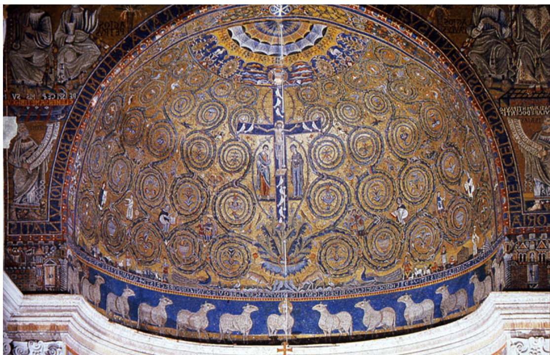
ψηφιδωτό της αψίδας του Αγίου Κλήμεντος στη Ρώμη (11ος αι.)

Κάποτε, όχι σπάνια, τη Θέση του Χριστού ή του Αμνού παίρνει το Δένδρο της ζωής/σταυρός. Στο ψηφιδωτό της αψίδας του Αγίου Κλήμεντος