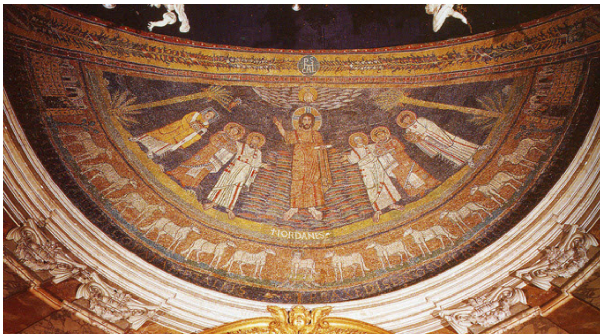
Αψίδα της Αγίας Πραξέδης, στη Ρώμη (9ο αι.) «ποταμός Ζωής»

Κάποτε, όχι σπάνια, τη Θέση του Χριστού ή του Αμνού παίρνει το Δένδρο της ζωής/σταυρός. Στο ψηφιδωτό της αψίδας του Αγίου Κλήμεντος