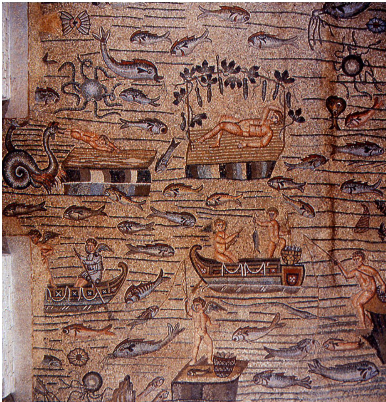
Περαχωριό της Κύπρου

Μια πηγή ως λεοντοκεφαλή παριστάνεται στα αριστερά της Παναγίας, για να δείξει πώς η Θεοτόκος γίνεται Ζωοδόχος πηγή με τη συμβολή της στο έργο της Ενσαρκώσεως. Όμως, προσέξτε : ● Ευαγγελισμός εδώ απεικονίζεται στα Ανατολικά σφαιρικά τρίγωνα του τρούλου, τα οποία φέρονται από τόξο διακοσμημένο με υδάτινα κύματα. Όπως ξέρουμε, ο τρούλος του ναού, συμβολίζει τον ουράνιο θόλο και προορίζεται για παραστάσεις θεοφανειών. Τα νερά του τόξου, λοιπόν, παραπέμπουν στον ουράνιο χώρο πάνω από το στερέωμα. Κατά συνέπεια, εδώ, ο Χαιρετισμός του Αγγέλου δεν αποτελεί απλώς ένα επεισόδιο της ζωής του Θεανθρώπου, αλλά υπογραμμίζει και τη θεϊκή υπόσταση του Υιού που συλλαμβάνει η Παρθένος. Με άλλα λόγια, οι εικονογραφικές λεπτομέρειες σχετικά με το νερό, που παραπάνω περιγράψαμε, συντελούν ώστε ο Ευαγγελισμός να