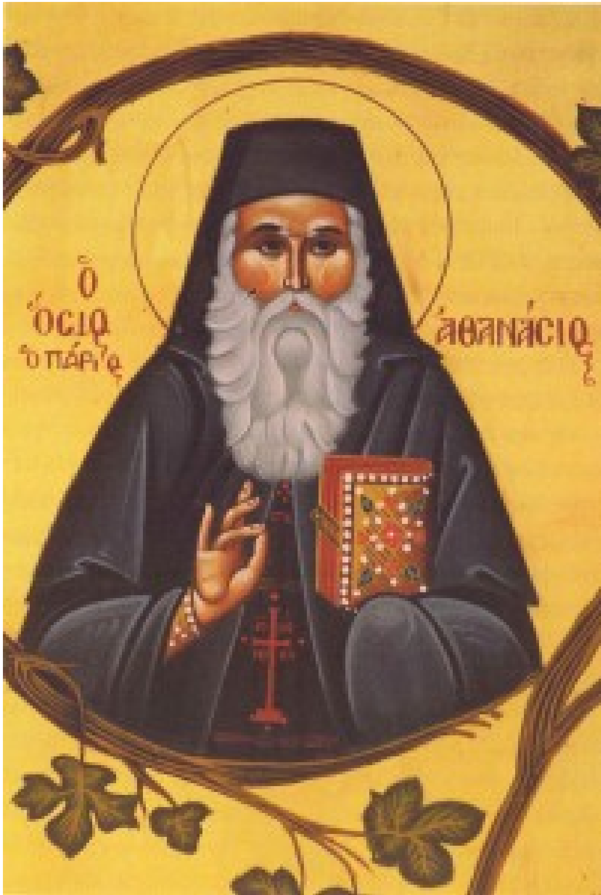
Ἅγιος Ἀθανάσιος ὁ Πάριος (1722-24.6.1813).