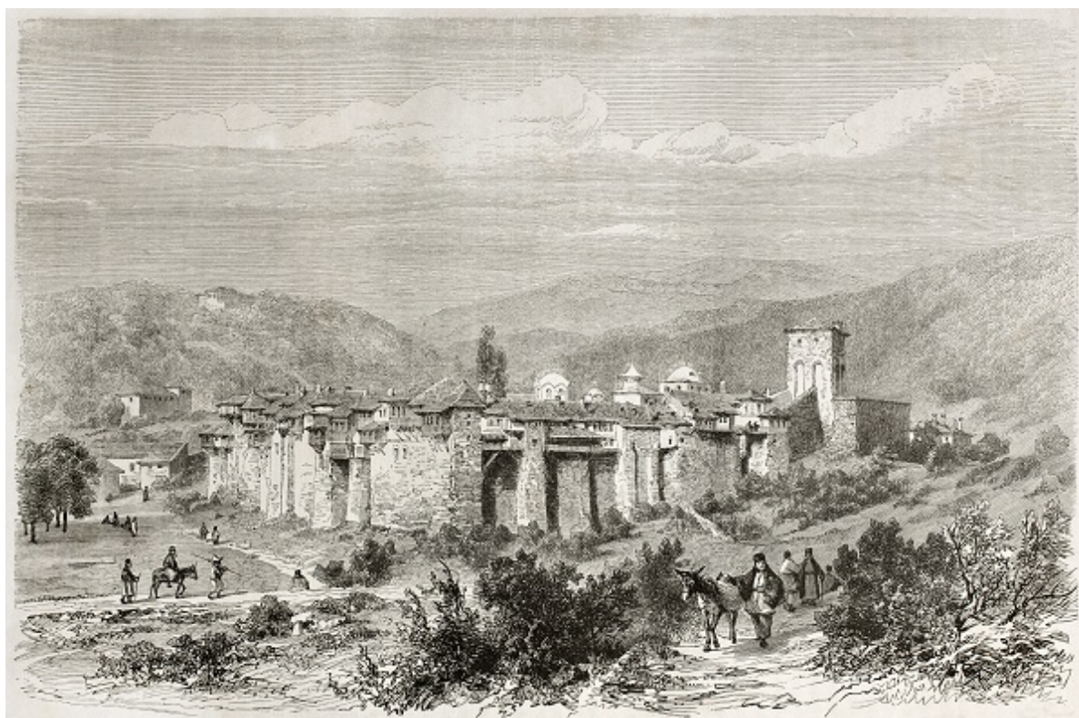
Ιερά Μονή Ιβήρων.