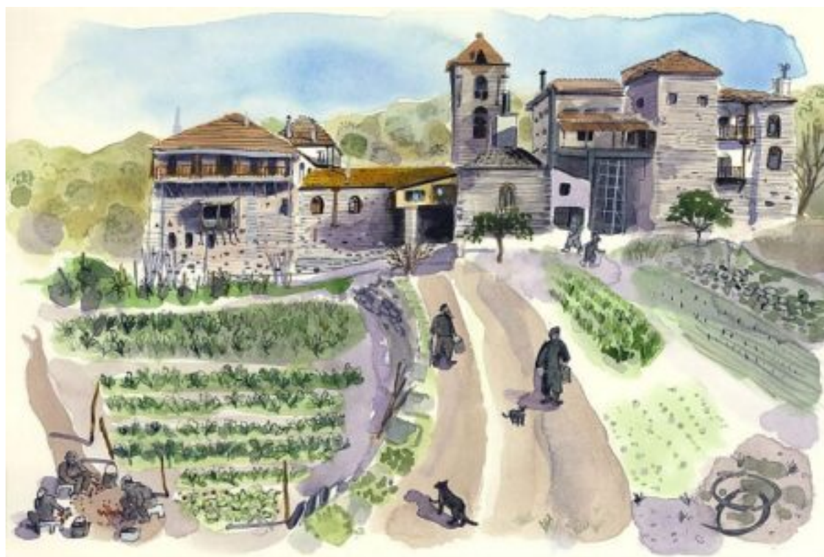
Έργο του Tim Vyner από την έκθεση «Μία εμπειρία ζωής στο Άγιον Όρος».

Παράλληλα, η Αγιορειτική Εστία παρουσιάζει την έκθεση ζωγραφικής του βρετανού εικαστικού, καθηγητή στη Σχολή Καλών Τεχνών του Bath Spa University της Μεγάλης Βρετανίας, Tim Vyner με τίτλο: «Μία εμπειρία ζωής στο Άγιον Όρος» που θα εκτεθεί στον χώρο της Δημόσιας Ιστορικής Βιβλιοθήκης της Ζαγοράς και θα παραμείνει καθ' όλη τη διάρκεια του καλοκαιριού (16 Ιουλίου έως 30 Σεπτεμβρίου).