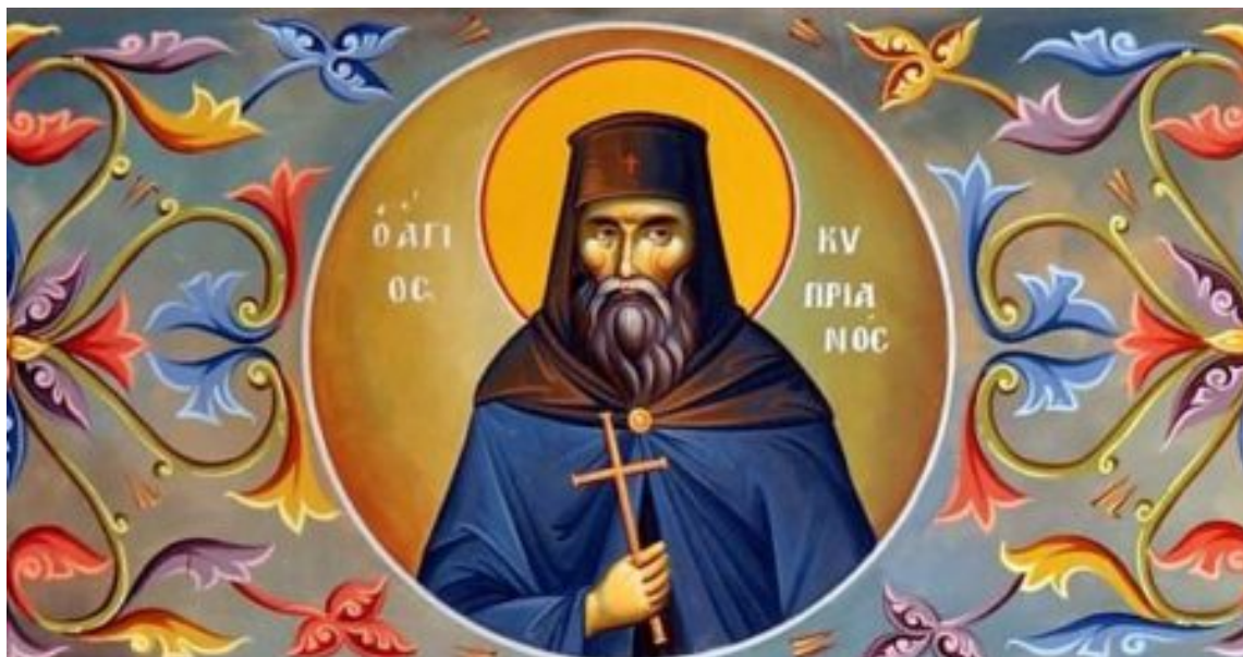
Άγιος Οσιομάρτυρας και Ιερομάρτυρας Κυπριανός.

(ς'). Ας υπάγωμεν εις την Ιεράν Μονήν του Κουτλουμουσίου.