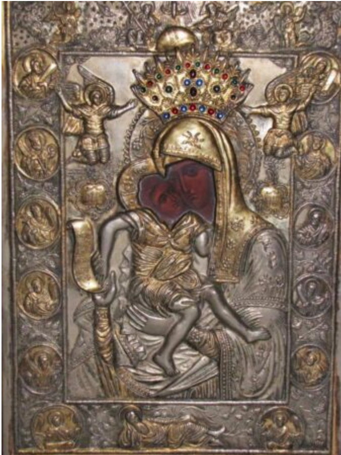
Η εικόνα της Παναγίας «Άξιόν εστιν» η οποία βρίσκεται στον Ναό του Πρωτάτου στις Καρυές Αγίου Όρους.

Επειδή δε επήραν το Λείψανον οι παντοκρατορινοί Πατέρες, ο μαθητής του Αγίου ομού με τον Πρώτον του Αγίου Όρους και με τον Άγιον Ιερισσού επήγαν και το έφεραν εις το άνωθεν κελλίον μετά παρρησίας, αφήσαντες την μίαν του χείρα εις το Μοναστήριον, κατέθεσαν δε το Λείψανον εις τα θεμέλια της Εκκλησίας και από τότε ήρχισε να αναβλύζη μύρον και ευωδία και έως της σήμερα· ενίοτε γίνεται επαισθητή εις τους εμβαίνοντας εις τον εκείσε Ναόν.