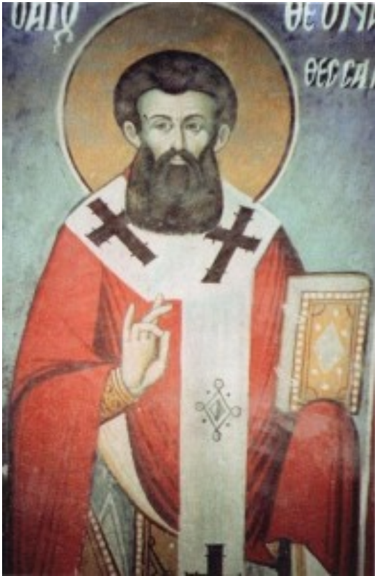
Άγιος Θεωνάς Αρχιεπίσκοπος Θεσσαλονίκης.

Συνέχεια από εδώ: http://www.pemptousia.gr/?p=377402