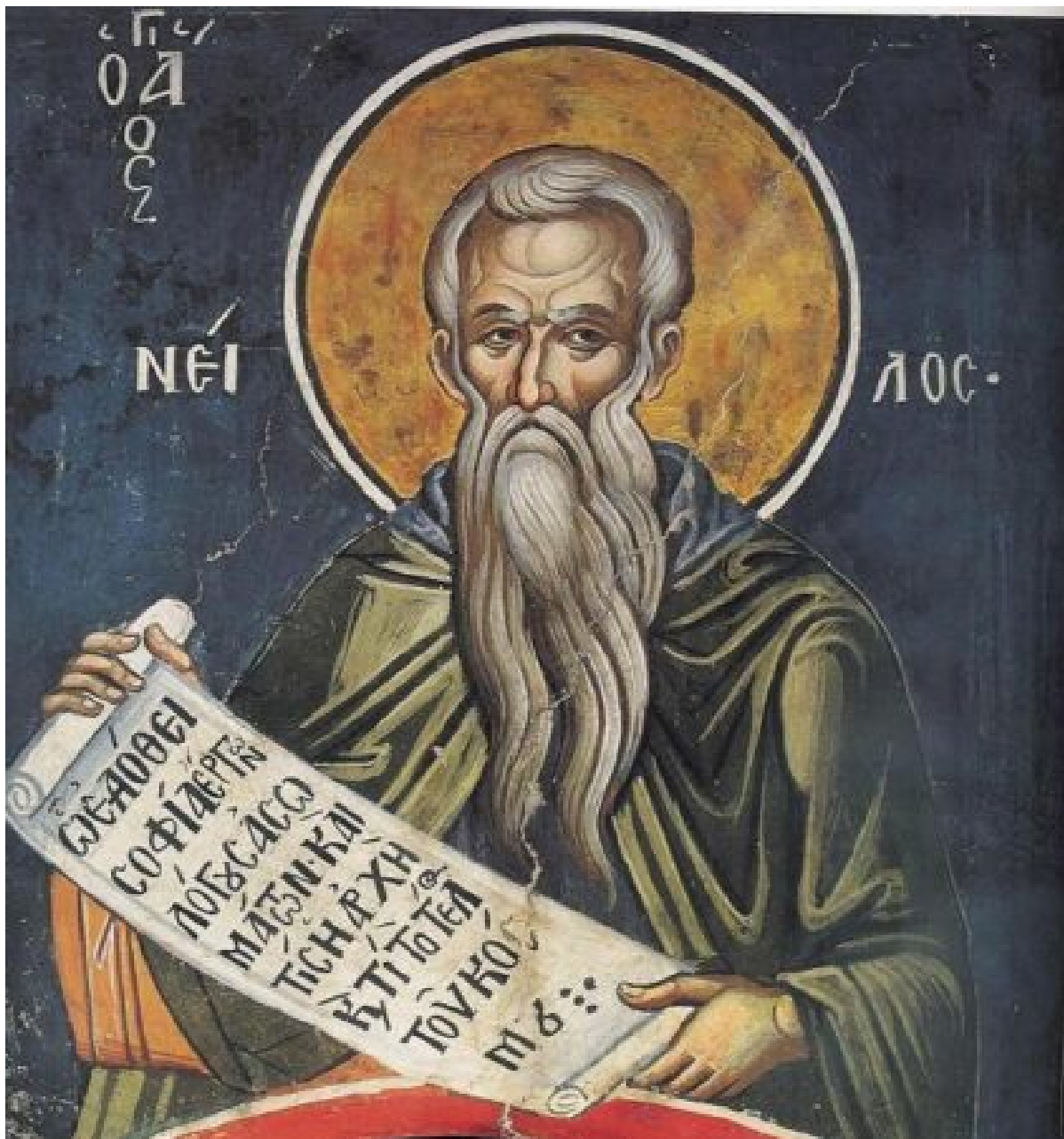
Άγιος Νείλος ο Ασκητής.