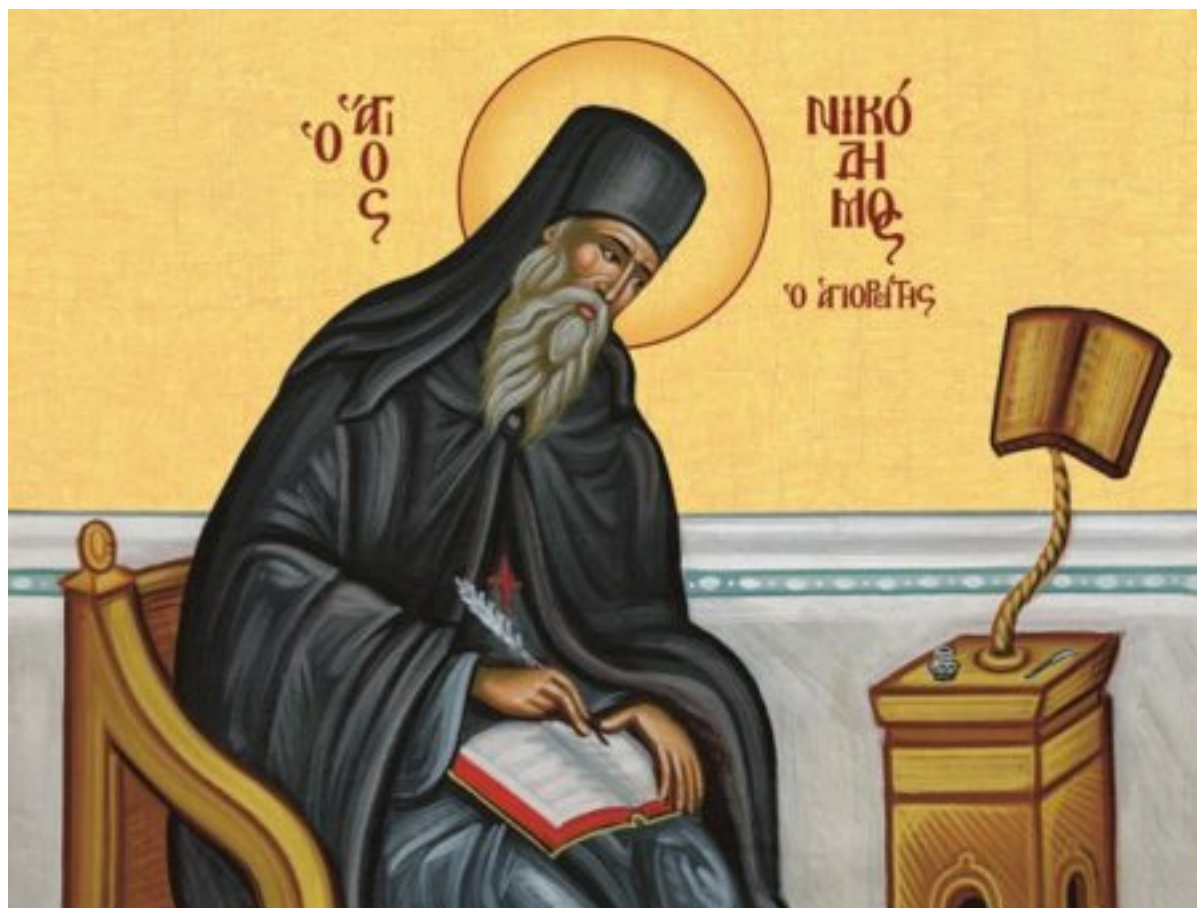
Άγιος Νικόδημος Αγιορείτης.