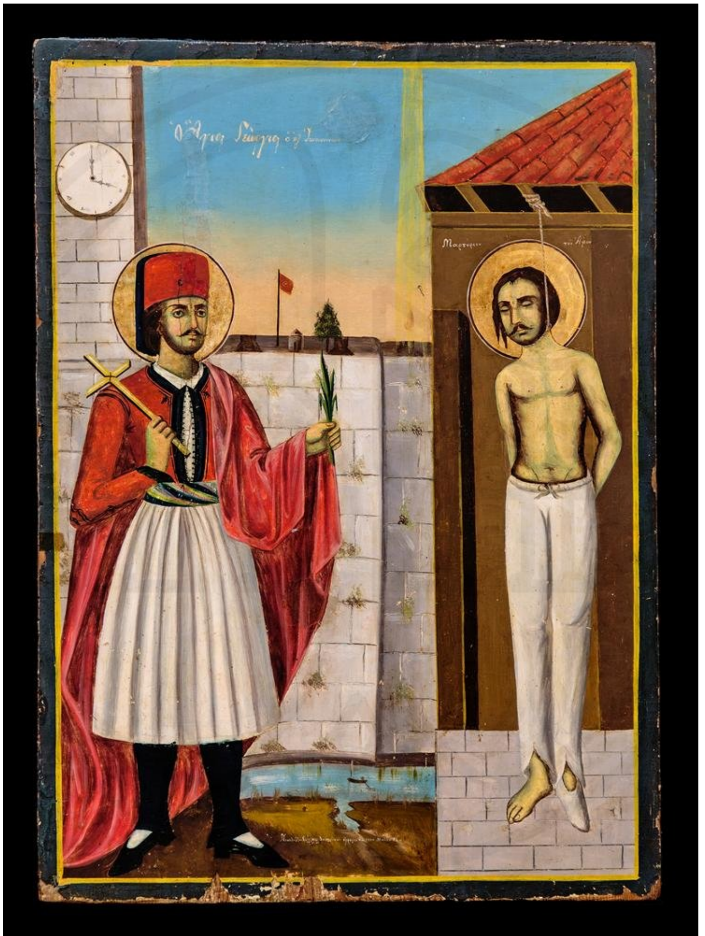
Η ακολουθία του Χρυσάνθου Λαϊνά γράφτηκε πριν από την επίσημη κατάταξη του