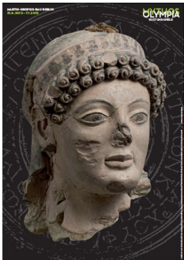
Αφίσα της Έκθεσης 1

Η έκθεση τελεί υπό την αιγίδα του Προέδρου της Ελληνικής Δημοκρατίας κ. Καρόλου Παπούλια και του Προέδρου της Ομοσπονδιακής Δημοκρατίας της Γερμανίας κ. Joachim Gauck.