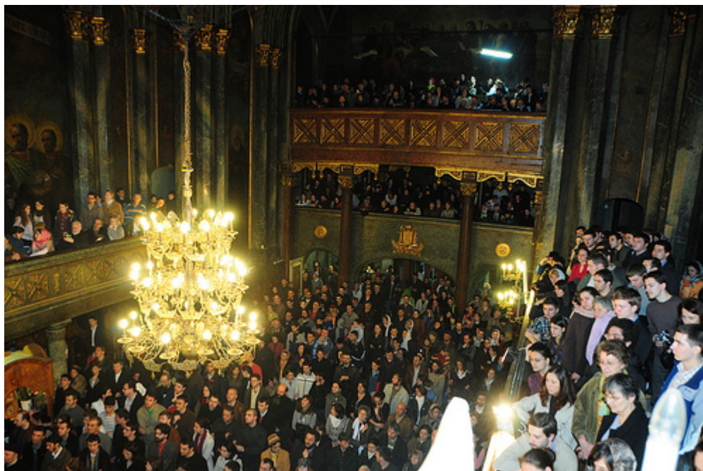
Κατάμεστος ο ναός της Αγίας Παρασκευής στην καταλακτήρια συναυλία

?? ?????????? ??? ?????????? ?????? ?? ? ??????????: