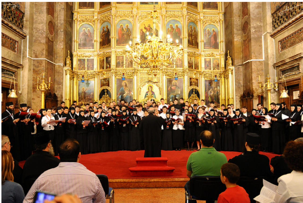
Στιγμιότυπο από την καταληκτήρια συναυλία

?? ???? ?????????????? ?? ?????? ???? ?????????????? ?? ??????????. ????? ???? ?????????? ???? ????????? ?? ?????? ??????????, ?? ?????????? ??????? ???? ?????????? ?? ???? ?????????? ?????????? ???? ??? ?? ?????? ?? ?????? ???? ?????????? ??????.