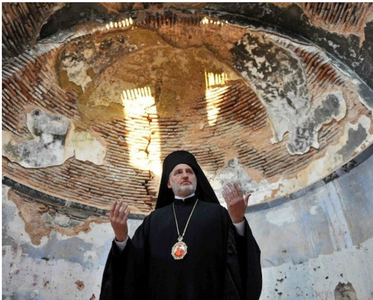
Ο Σεβ. Μητροπολίτης Προύσας κ. Ελπιδοφόρος στον Ι.Ν. Ταξιαρχών

Ο ναός βρίσκεται σε μια τουριστική περιοχή, στο δρόμο που συνδέει την Τρίγλια με το Μαρμαρά, στην επαρχία της Προύσας και χτίστηκε το 789 επί αυτοκράτορος Κωνσταντίνου Στ' (και όχι του Κωνσταντίνου Ζ' Πορφυρογέννητου, όπως επανειλημμένως αναδημοσιεύουν τα μέσα της γείτονος).