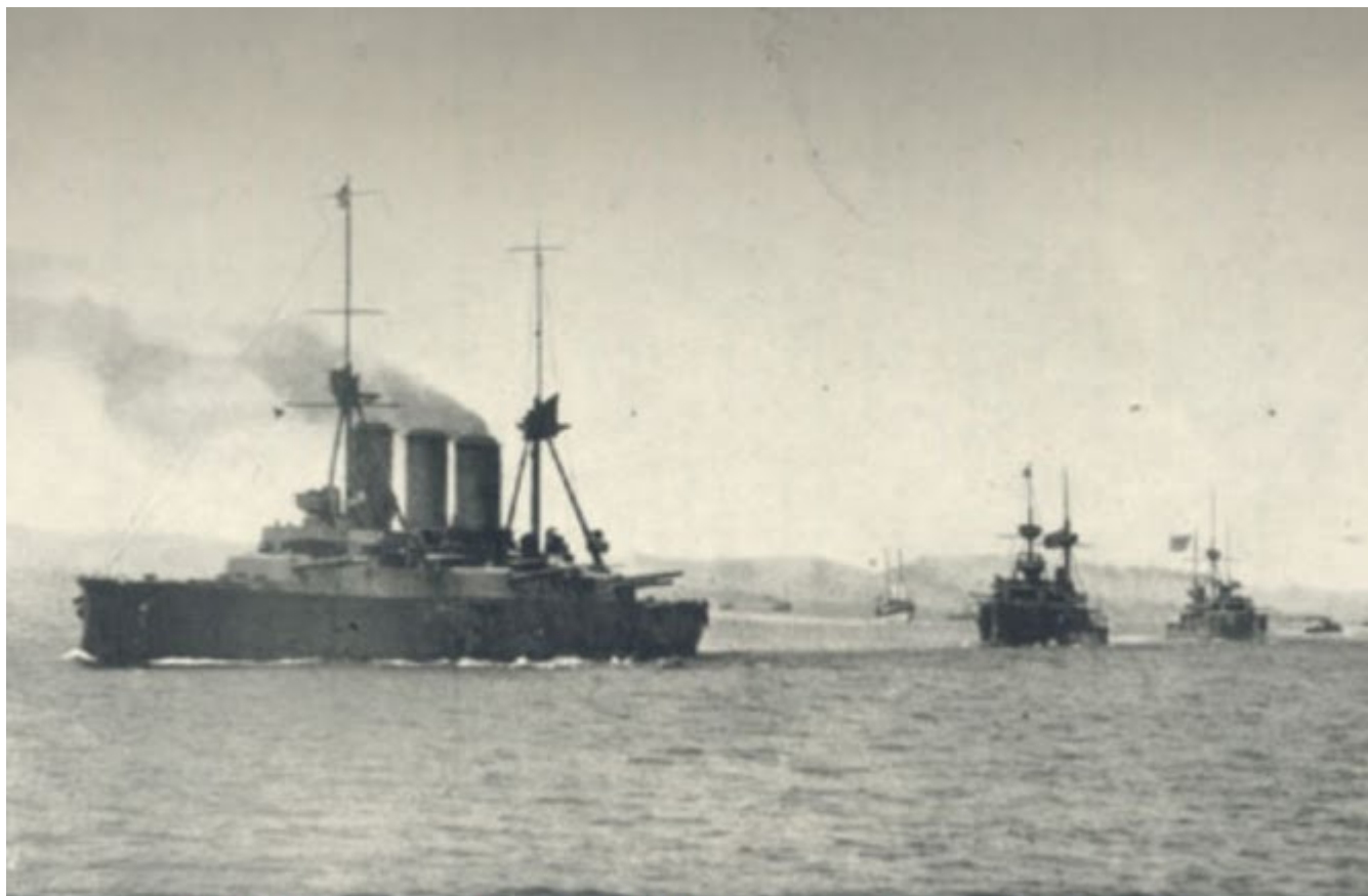
Το θορυκτό «ΑΒΕΡΩΦ» επικεφαλής νηοπομπής

Στις 4 Νοεμβρίου 1912 η Ιερά Κοινότητα αποστέλλει ευχαριστήριο τηλεγράφημα για την απελευθέρωση του Αγίου Όρους στον πρωθυπουργό Ελευθέριο Βενιζέλο, ο οποίος και απάντησε ως εξής: