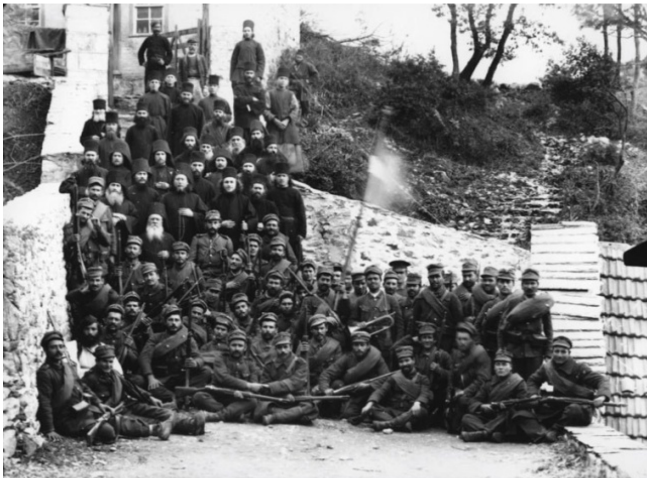
Ο ελληνικός στρατός στη Κερασιά