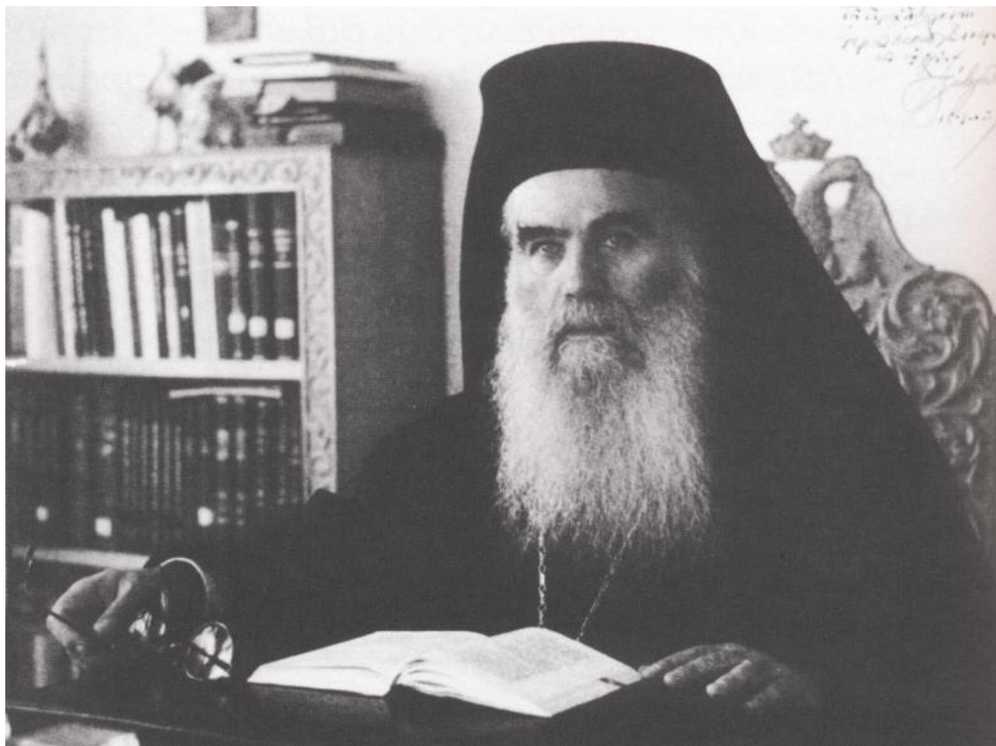
Στο Μητροπολιτικό του γραφείο λίγο καιρό πριν από την κοίμησή του.

σπούδασε στην Αθωνιάδα Σχολή και κατόπιν στην Θεολογική Σχολή της Χάλκης. Το 1934 χειροτονήθηκε εκεί διάκονος και το 1935 πρεσβύτερος.