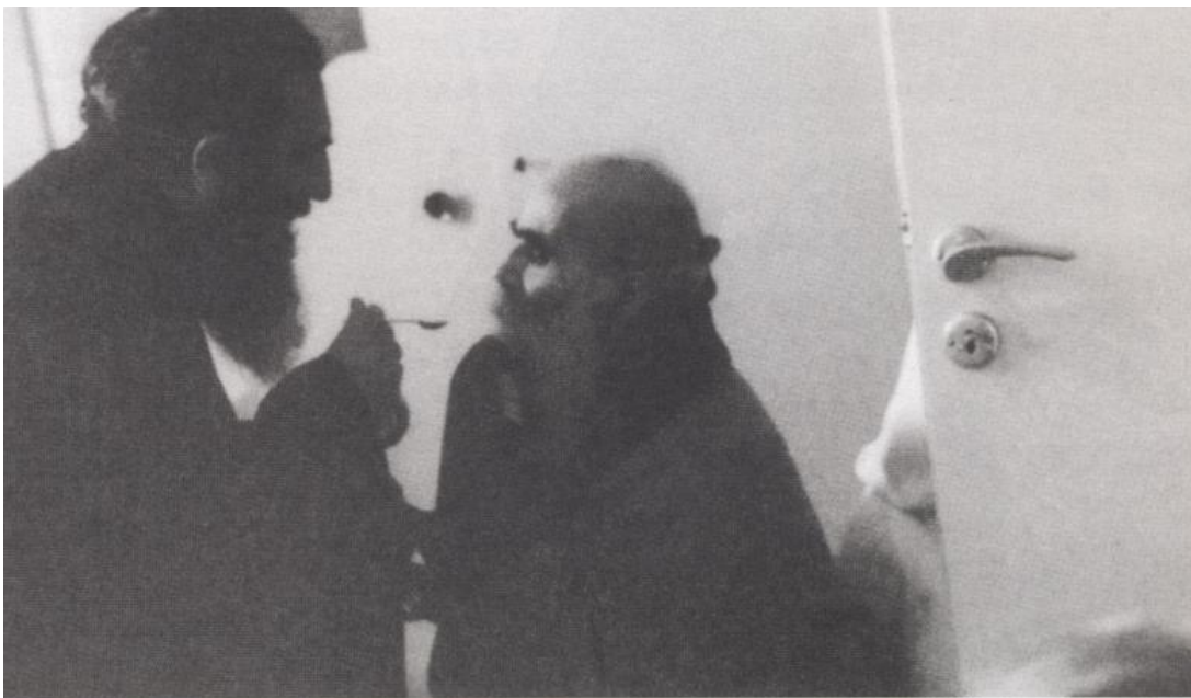
«Σώμα και αίμα Κυρίου εις ζωήν αιώνιον» από τον μακαριστό Μητροπολίτη κυρό Πολύκαρπο

Το σπίτι εκείνο ήταν πραγματικά μια Επισκοπή με την παλαιοχριστιανική έννοια, ήταν ένα μάτι και μια καρδιά πού επισκοπούσε μέρα-νύχτα με ασταμάτητη αγάπη και εγρήγορση τους πάντας και τα πάντα. Δεν ήταν «Μητροπολιτικό μέγαρο» [...] Καλλίτερα θα μπορούσε να ονομασθή Κοινόβιο. «Μοναστήρι», σαν τόπος ασκήσεως και προσευχής, «Αδελφότης», σαν τόπος αγάπης και αδελφосύνης, «Φροντιστήριο», σαν τόπος ποιμαντικής και ιεραποστολικής εκπαιδεύσεως. [...] Στις υψηλές θεωρίες κοινωνιολόγων και φιλοσόφων του αιώνας, η Λήμνος απαντούσε εμπράγματα με την σιωπηλή της επανάσταση, [...] ότι και στις μέρες μας μπορεί να περπατήσει ο Ιησούς ανάμεσα μας»(7).