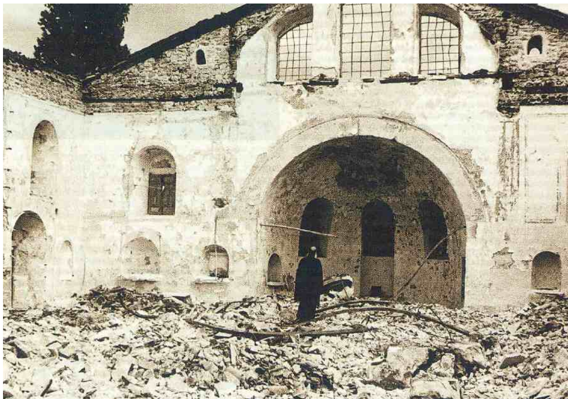
Ο Πατριάρχης Αθηναγόρας προσεύχεται μπρος στην αναποδογυρισμένη Αγία Τράπεζα της κατεστραμμένης Παναγίας Βελιγραδίου (Μπελγρατκαπού) [© Κληρονόμοι Δημητρίου Καλούμενου / Διπλωματικό και Ιστορικό Αρχείο ΥΠΕΞ].