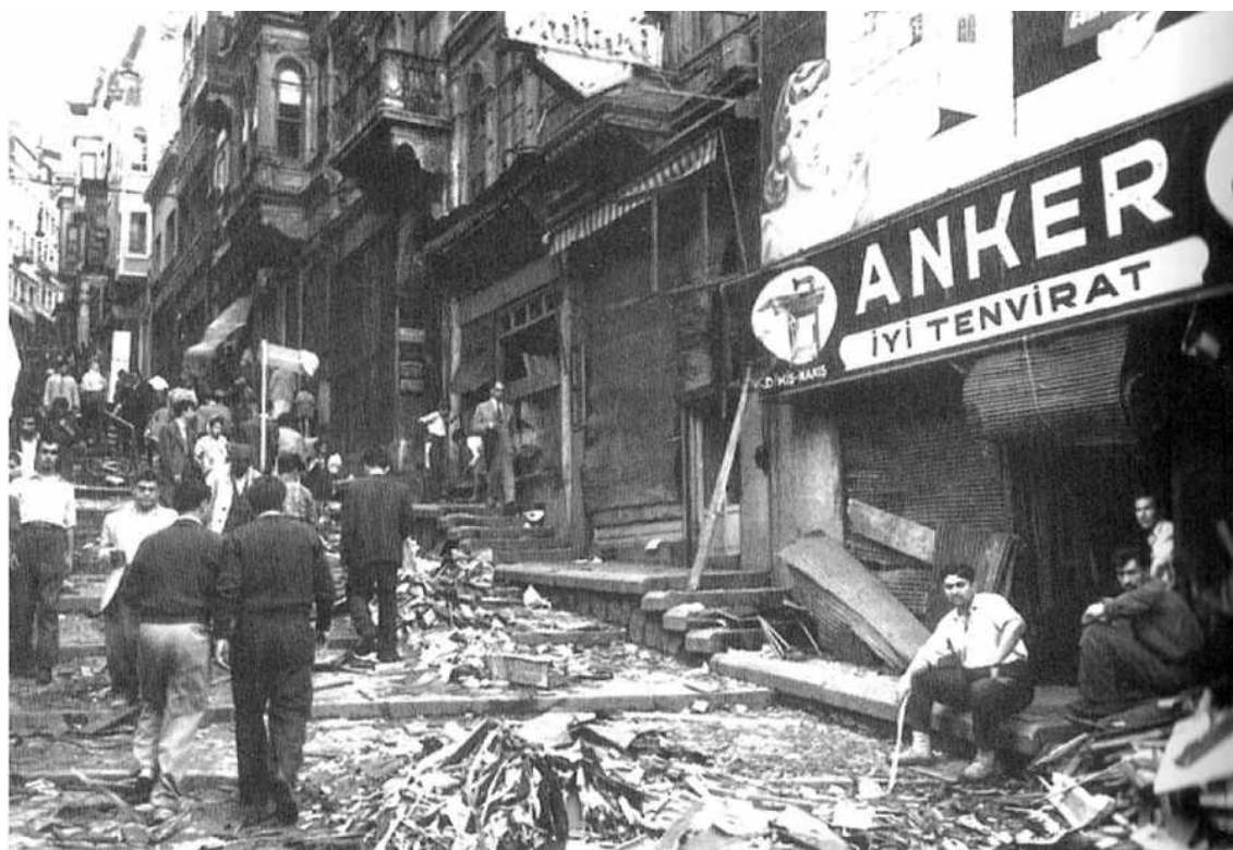
Κατεστραμμένα καταστήματα, διαλυμένα προϊόντα και πεζοί στα σκαλάκια (Γιουμτσέκ Καλντιρίμ).

Μέσα σε λίγες ώρες, σαράντα πέντε Ελληνικές Κοινότητες είχαν δεχτεί βίαιες επιθέσεις με εμπρησμούς και βανδαλισμούς· τα σπίτια, τα καταστήματα, οι Εκκλησίες, τα κοιμητήρια, είχαν μετατραπεί σε ερείπια. 16 ομογενείς έχασαν τη ζωή τους, ενώ 200 γυναίκες έπεσαν θύματα βιασμού. Κατά τη διάρκεια των θλιβερών αυτών επεισοδίων καταστράφηκαν 73 Ορθόδοξοι Ναοί, 8 αγιάσματα, 2 Μονές, 26 ελληνόφωνα σχολεία, 5 ελληνικοί μορφωτικοί και αθλητικοί σύλλογοι, 1004 σπίτια, 4348 καταστήματα, 26 φαρμακεία, 21 εργοστάσια και 110 ξενοδοχεία και εστιατόρια.