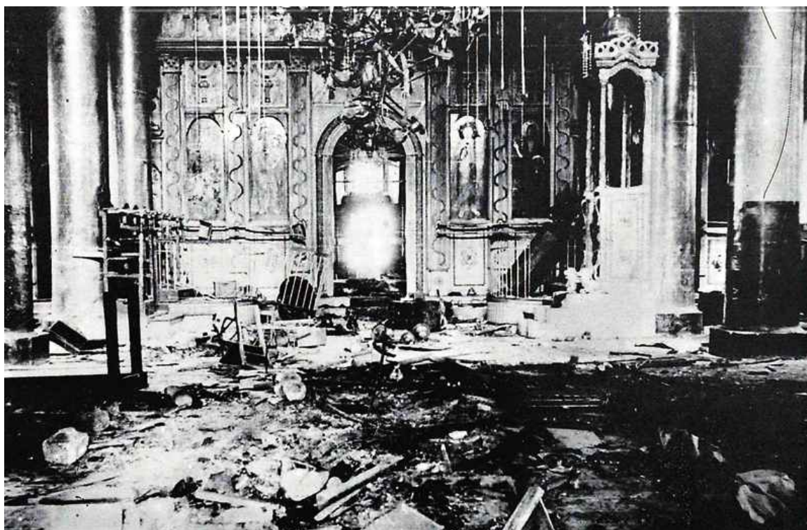
Εσωτερικό εκκλησίας μετά την «περιποίηση...» των Τούρκων...