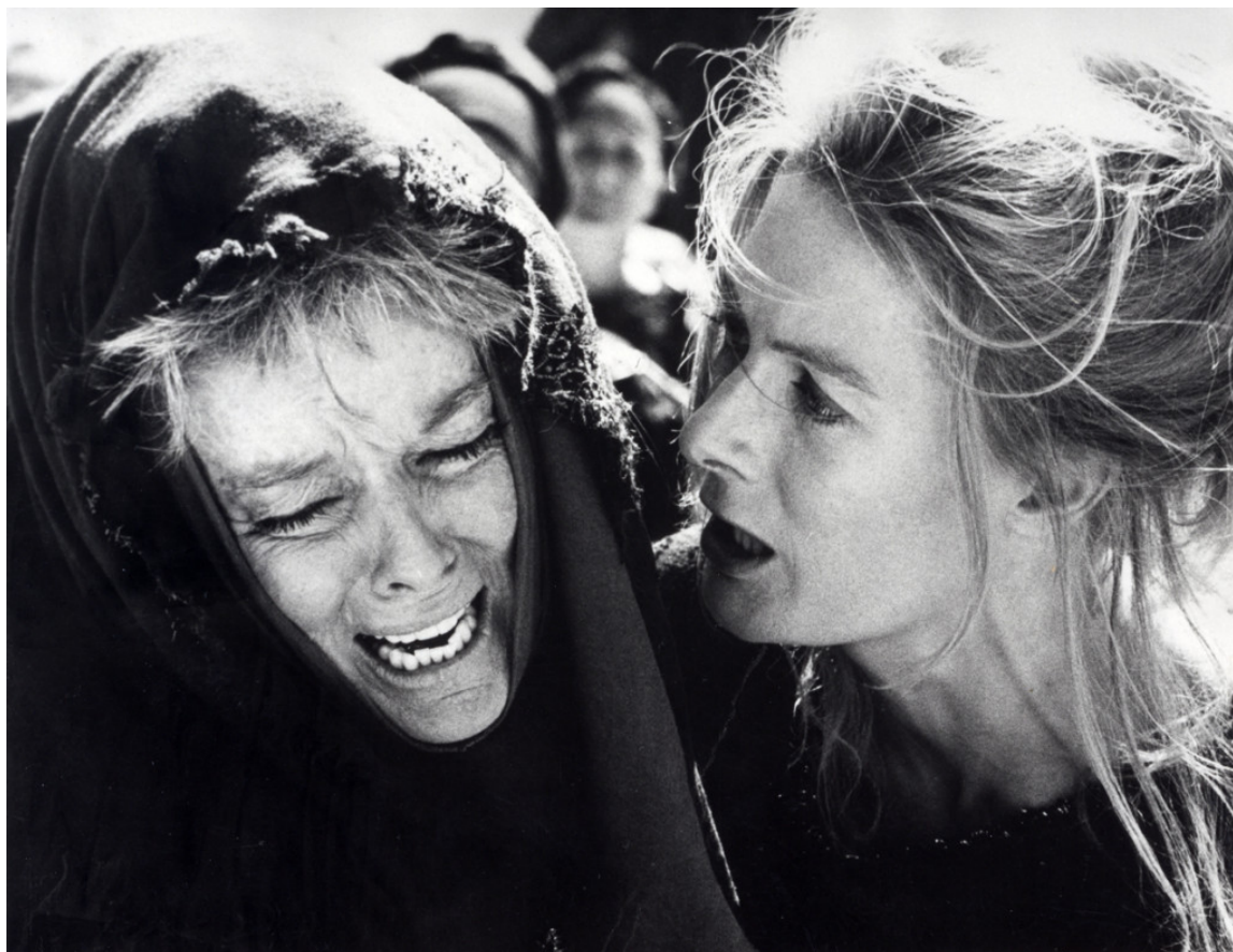
IMK, Τρωάδες, Κ. Hepborn, V. Redgrave

Το Ίδρυμα Μιχάλης Κακογιάννης , με την ευκαιρία της προβολής των “Τρωάδων” σημειώνει ιδιαίτερα τα επίκαιρα λόγια του ίδιου του μεγάλου σκηνοθέτη: