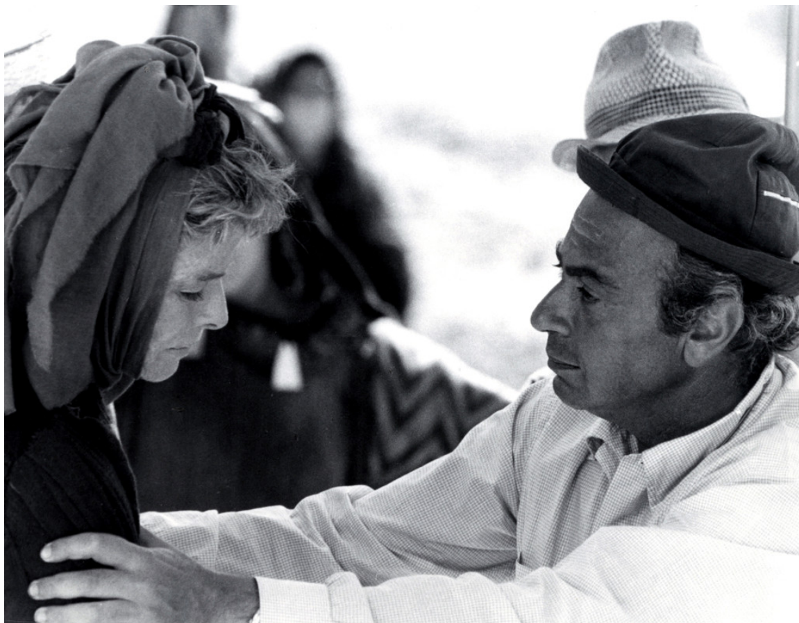
IMK, Τρωάδες, Κ. Hepborn, Μ. Κακογιάννης

Ο Ευριπίδης έγραψε τις “Τρωάδες” , το 415 π.Χ. για έναν πολύ συγκεκριμένο λόγο. Νιώθοντας φρίκη από τη σφαγή που διέπραξαν οι Αθηναίοι στη Μήλο, ήθελε - χρησιμοποιώντας τον πόλεμο της Τροίας- να αφυπνίσει τους συγχρόνους του ενάντια στον πόλεμο και στην καταπίεση.