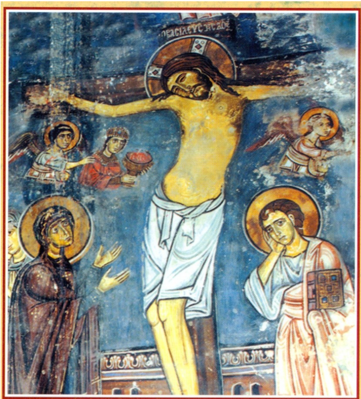
Η Σταύρωση του Χριστού. Τοιχογραφία από τον ναό της Εγκλείστρας του Αγ. Νεοφύτου.

Αφού βγήκα και άρχισα να σκάβω και, ενώ λάξευα από τη μια πλευρά, ο κρημνός και απ' τις δυο πλευρές γινότανε κομμάτια και έπεφτε, κι εγώ έλεγα ψιθυρίζοντας: «ο στερεώσας κατ' αρχάς τους ουρανοὺς ἐν συνέσει και την γην ἐπὶ υδάτων εδράσας', Αυτός ουν, Κύριε, και τούτο στερέωσον το οίκημα». Και πάλιν έλεγον• «ακήκοα, Κύριε, του μελωδού φάσκοντος, ότι ο κατοικῶν ἐν βοήθεια του Υψίστου ἐν σκέπη τη Αυτού αλισθήσεται', αντίληψίν τε και καταφυγήν την σην κεκτημένος ευμένειαν, ου φοβείται ἀπό φόβου νυκτερινού, ουδέ ἀπό βέλους πετομένου ημέρας, ουδέ ἀπό ἀπό συμπτώματος και δαιμονίου μεσημβρινού.' Επει ουν καγώ, Κύριε, ο ταπεινός και ανάξιος, διά της σης προνοίας τε και βοήθειας ενθάδε οίκησα και