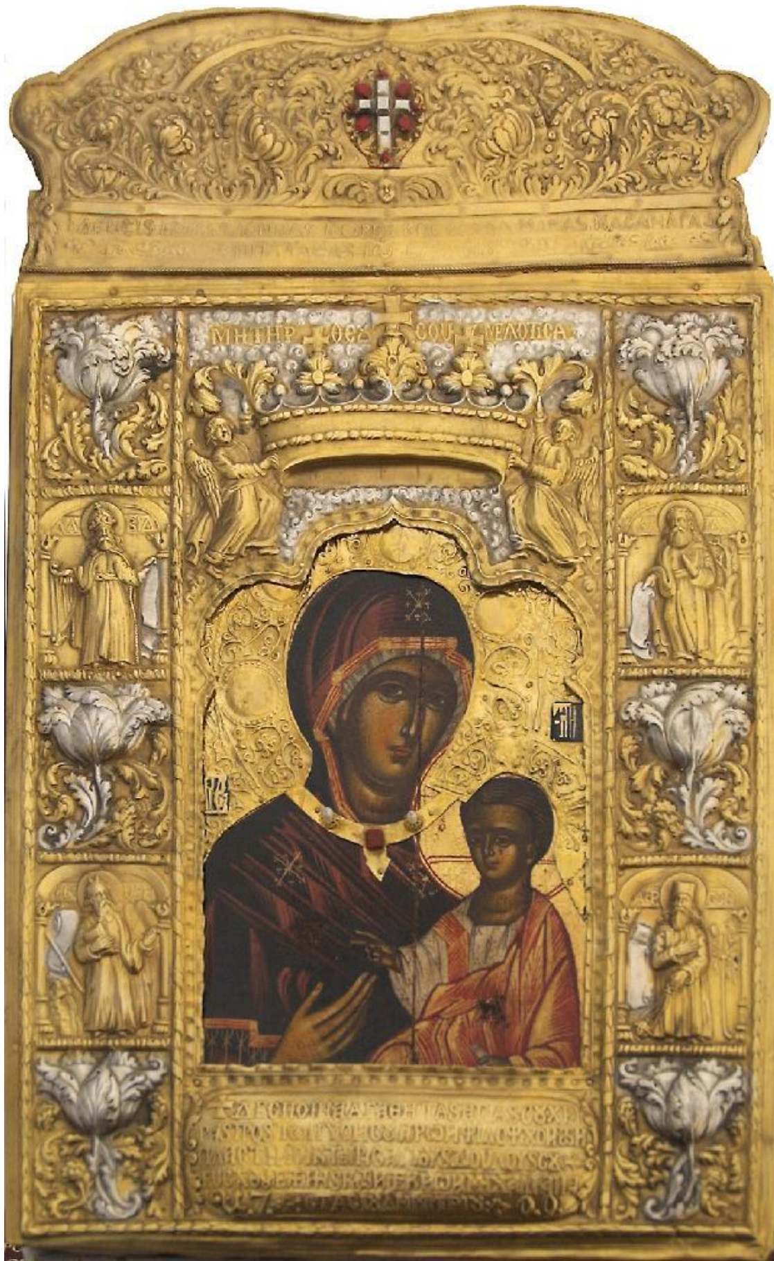
Η εικόνα της Παναγίας Σουμελά