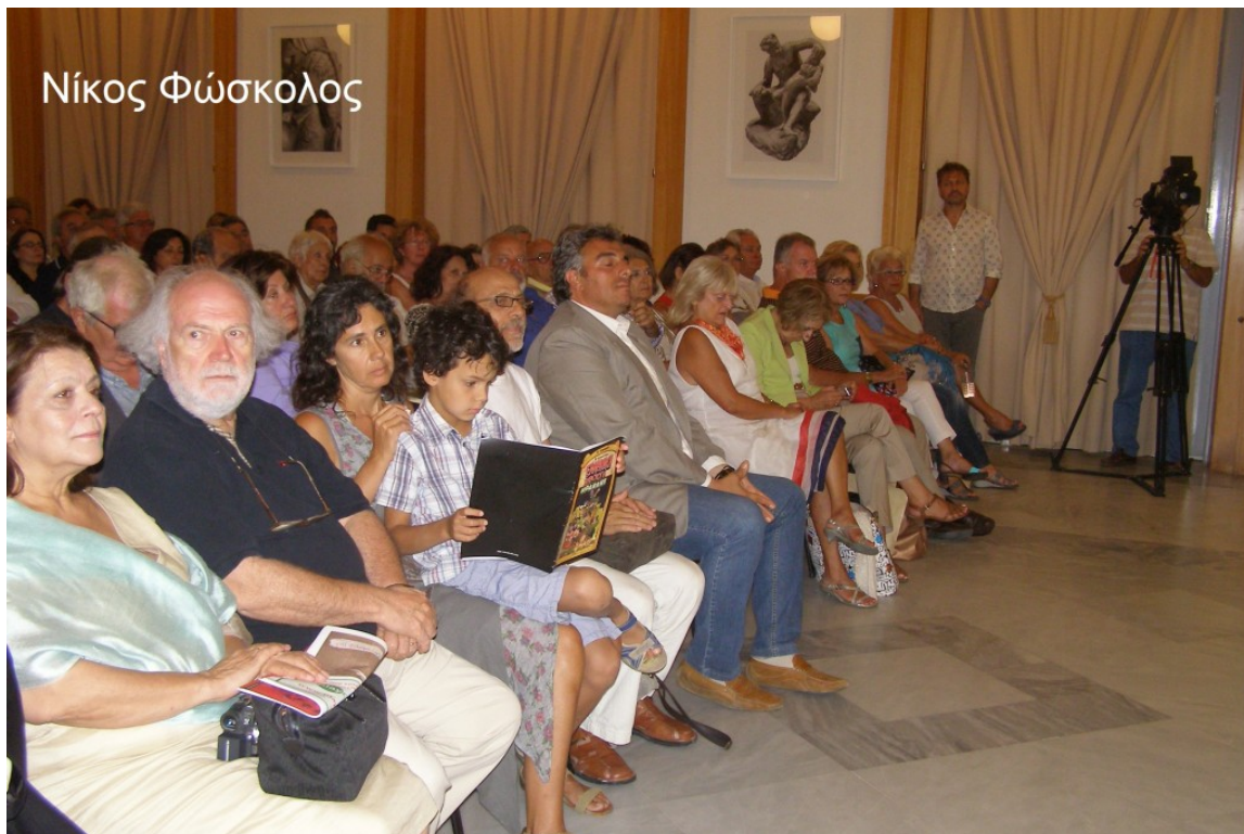
Κατάμεστη η αίθουσα του Ι.Τ.Η.Π, την ημέρα της παρουσίασης του τόμου.