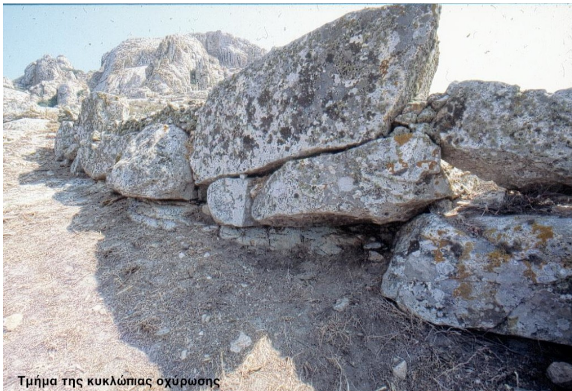
Τμήμα της κυκλώπιας οχύρωσης