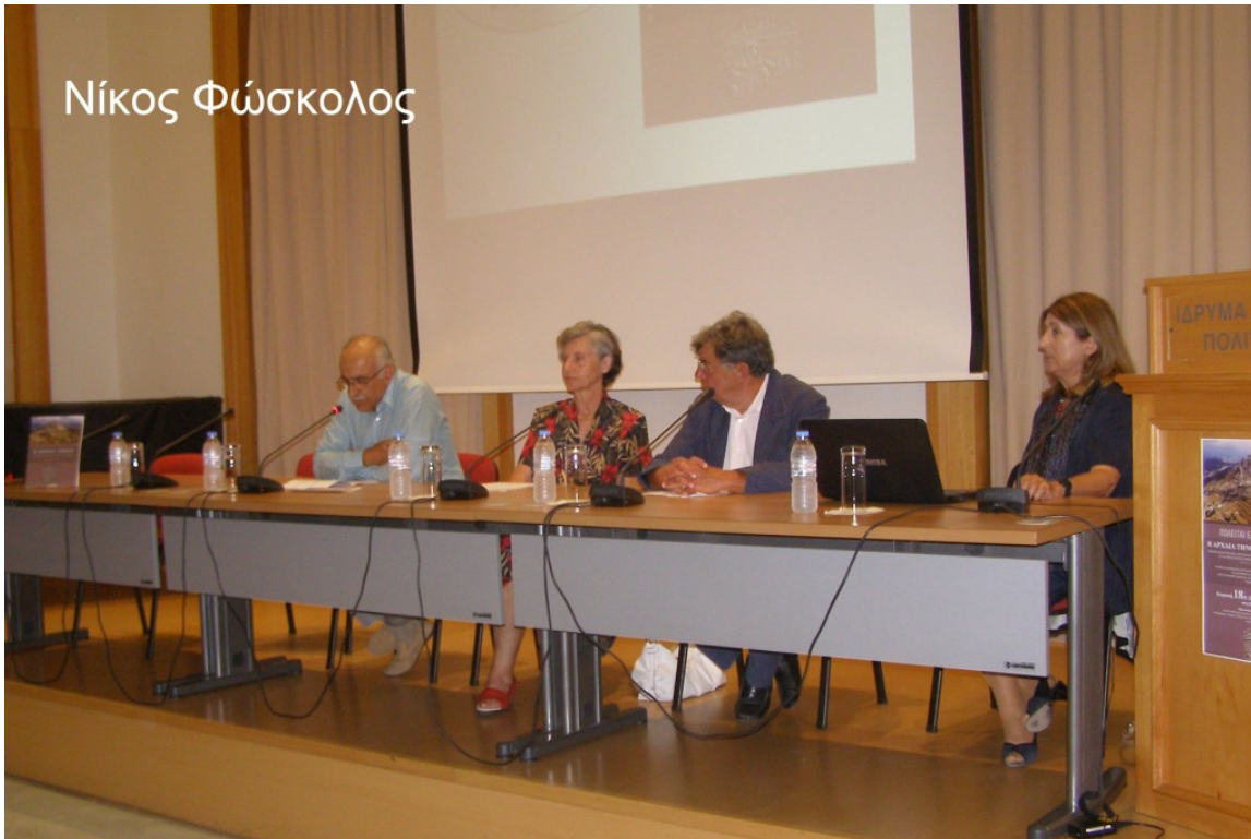
Οι συγγραφείς του τόμου.