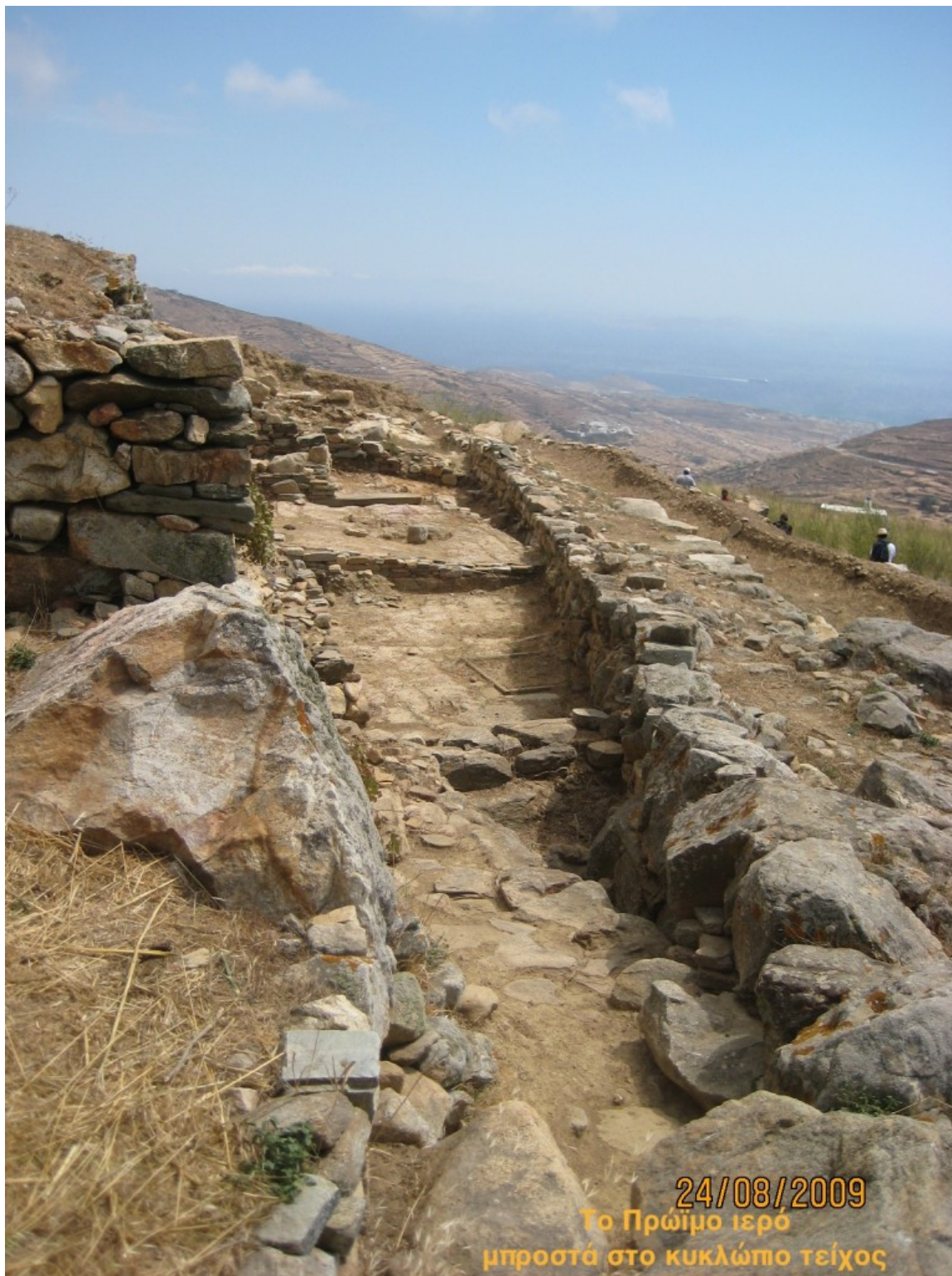
Το πρώιμο ιερό μπροστά στο Κυκλώπιο τείχος

Το τελευταίο είναι ιδιαίτερα σημαντικό γιατί διασώζεται καλά και μέσα από τις διαδοχικές φάσεις του βλέπει κανείς πως εξελίχθηκαν τα πρωτόγονα υπαίθρια ιερά σε ιερά με βάση ένα κτίσμα, ένα ιερό οίκο- ή ναό. Όλα αυτά συνολικά δίνουν πολλές και ουσιαστικές πληροφορίες για τον πρώιμο οικισμό και την ιστορία της Τήνου. Ιδιαίτερα σημαντικά είναι επίσης τα ευρήματα στο κλασικό νεκροταφείο, στην ανατολική πλευρά του λόφου, όπου ο αριθμός και κυρίως η ποιότητα των