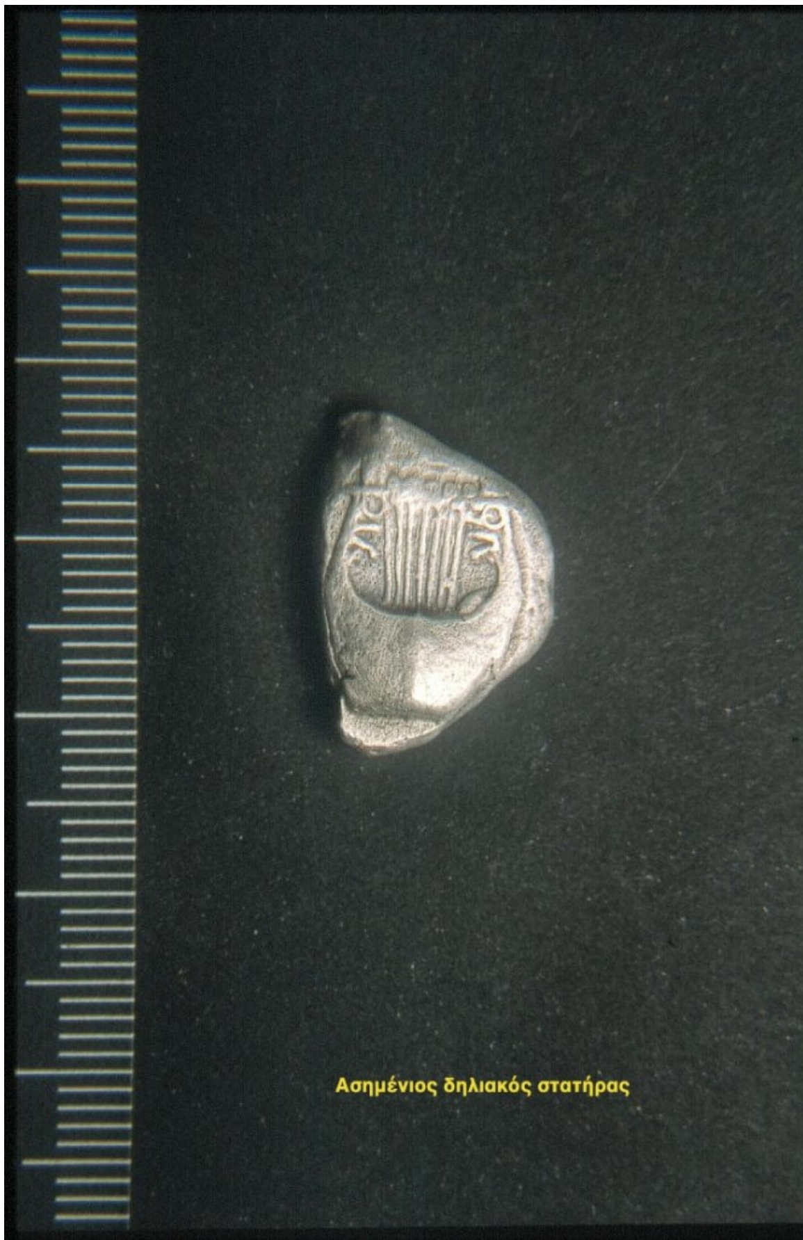
Ασημένιος δηλιακός στατήρας

-Ποιες ήταν οι πρώτες δυσκολίες που αντιμετώπισαν οι Αρχαιολόγοι;