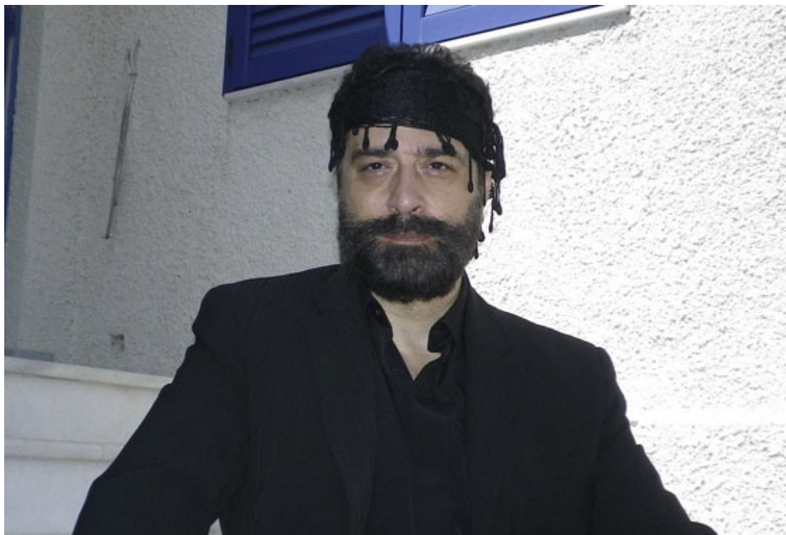
Γρηγόρης Ορφανουδάκης (ηθοποιός)