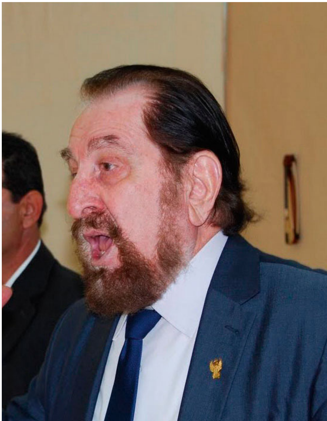
Λάζος Τερζάς (ηθοποιός)