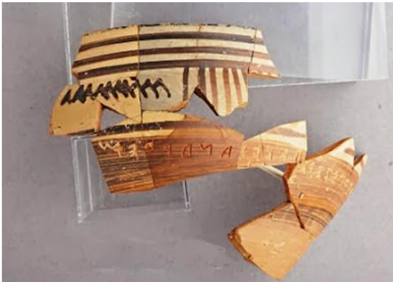
Ευβοϊκός σκύφος με εγχάρακτη επιγραφή: Είμαι [το ποτήρι/αγγείο;] του Ακεσάνδρου. [... όποιος μου το στερήσει ... τα μά]τια του (ή τα χρήματά του) θα στερηθεί. Ευβοϊκό αλφάβητο και ιωνική διάλεκτος, περίπου 720 π.Χ.

Η σπουδαιότητα του ευρήματος έγκειται στο γεγονός ότι από τον 8ο αι. π.Χ., όταν άρχισε να χρησιμοποιείται η αλφαβητική γραφή στον ελλαδικό χώρο, υπάρχουν ελάχιστες επιγραφές και επιγραφικά τεκμήρια, και συνεπώς τα ενεπίγραφα αγγεία της Μεθώνης είναι πραγματικά πολύτιμα. Ειδικότερα για τη Μακεδονία πρόκειται για τα πρωιμότερα μέχρι σήμερα επιγραφικά ευρήματα.