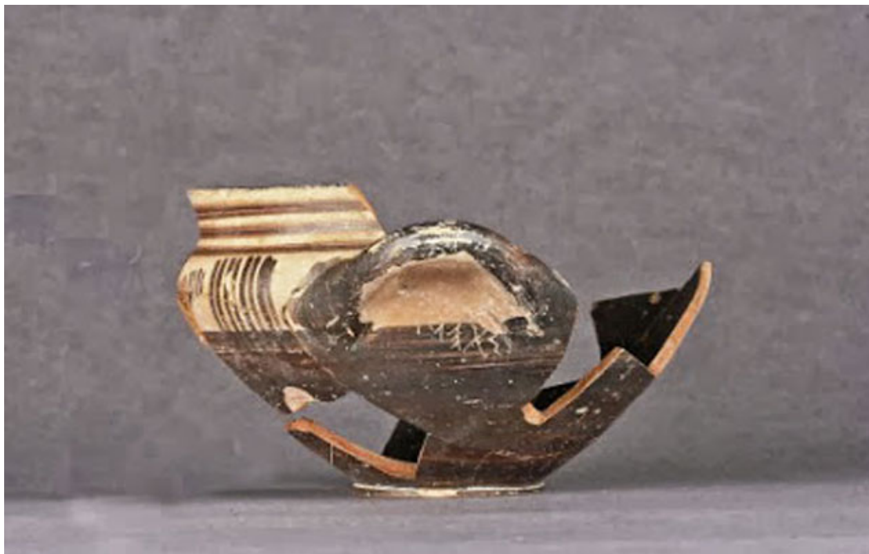
Σκύφος από τον Θερμαϊκό Κόλπο ύστερου 8ου - πρώιμου 7ου αι. π.Χ. με την επιγραφή του ονόματος του κατόχου του, Χσενι-

Πρόκειται για μια δυσερμήνευτη κατασκευή, πιθανόν αποθηκευτικού χαρακτήρα, η οποία λόγω στατικών προβλημάτων δεν ολοκληρώθηκε ποτέ και επιχώθηκε βιαστικά λίγο μετά το 700 π.Χ. με κάθε είδους υλικά (δηλαδή όστρακα, ξύλα, τμήματα λίθινων μητρών από μεταλλουργικές δραστηριότητες, σκωρίες χαλκού και σιδήρου, πήλινες χοάνες κατεργασίας χαλκού και χρυσού κ.ά.).