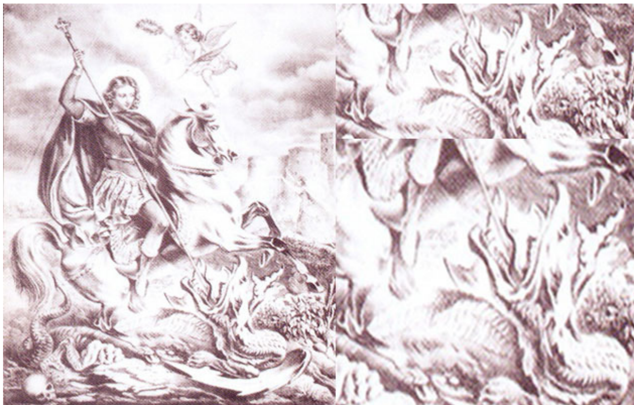
χαλκογραφία του αγίου Γεωργίου δρακοκτόνου (1853), Μουσείο Βυζαντινού Πολιτισμού

κολασμένους είδε σε μια γωνία απομονωμένο το Σατανά να κλαίει και να οδύρεται. Του είπε αμέσως ότι και πάλι θα γεμίσει το βασίλειό του με κυβερνήτες, πλούσιους δικαστές και άλλους! Προφανώς όλα αυτά σαρκώνουν μια βαθιά πολιτιστική παράδοση με υψηλού θεολογικού περιεχομένου αλήθειες.