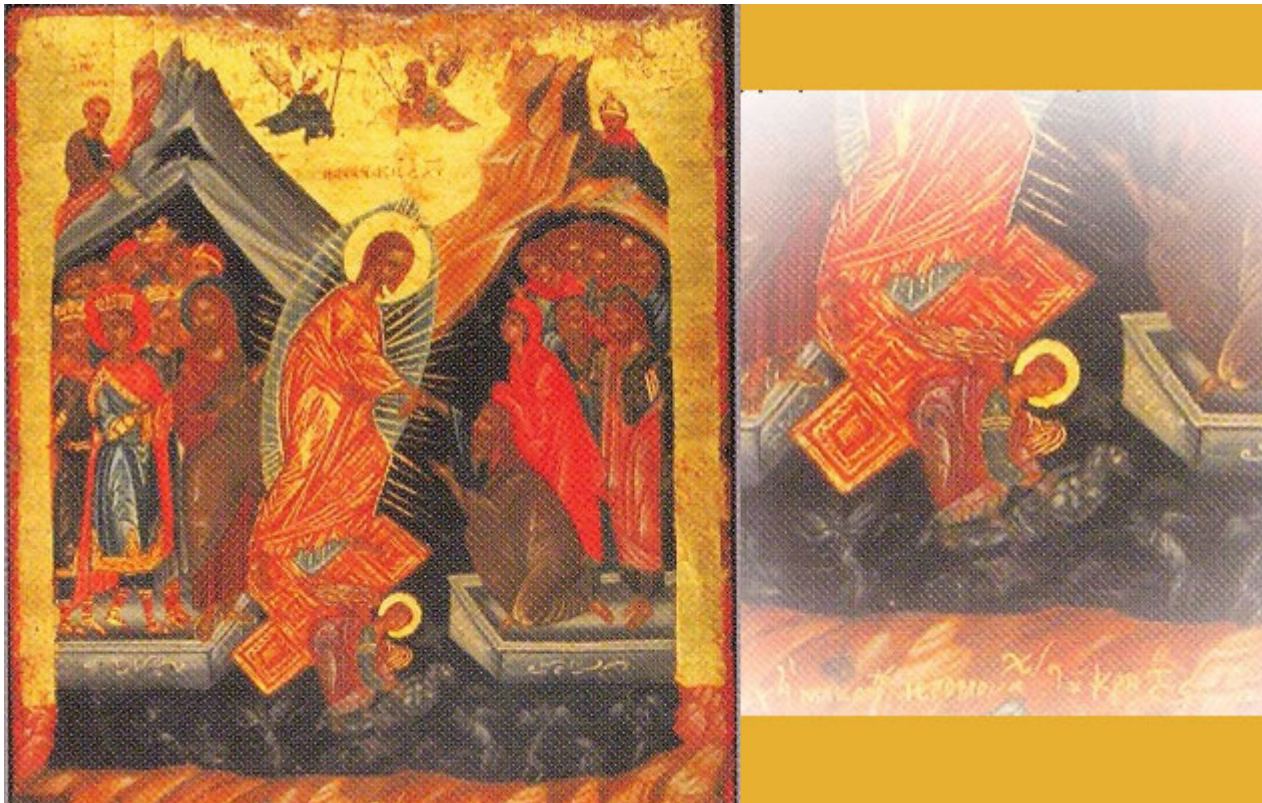
Εις Άδου Κάθοδο του Χριστού (1663), Μουσείο Βυζαντινού Πολιτισμού

Οι μυθικές επίσης διηγήσεις περί διαβόλου και δαιμόνων προβάλλονται ως εικόνες τέχνης και δεν απορρίπτονται. Και νομίζω ότι αυτή η λειτουργία του μύθου και της αλήθειας που κρύβεται πίσω απ' αυτόν, ο οποίος αποτυπώνεται και στις εικόνες, είναι η ερμηνεία της παρουσίας του κακού μέσα στην τέχνη και τη λατρεία.