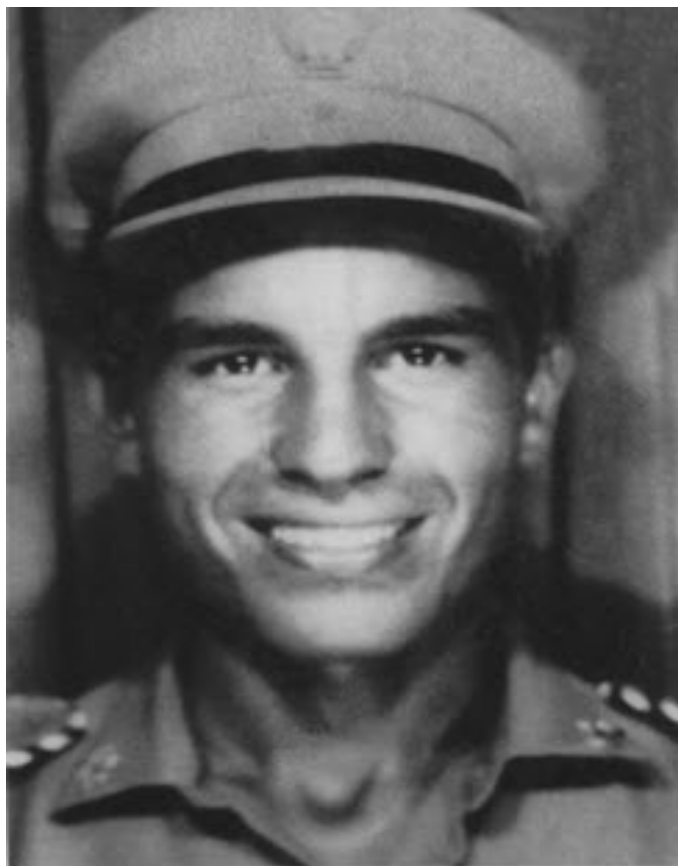
Ντυμένος με τη στολή του ανθυπολοχαγού