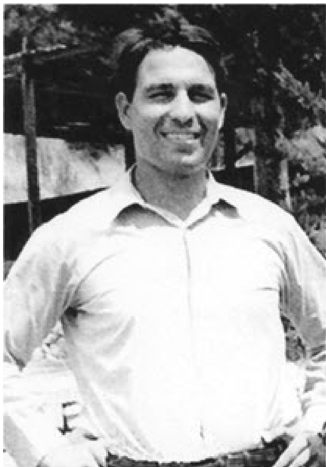
Στην κατασκήνωση ως Αρχηγός

Ένα ποίημά του για την αγαπημένη του Βόρειο Ήπειρο, που έγραψε όταν ήταν σε κατασκήνωση στα ελληνοαλβανικά σύνορα είναι το ακόλουθο, που δημοσιεύτηκε στο περιοδικό «Η Δράσις μας», στην Αθήνα: