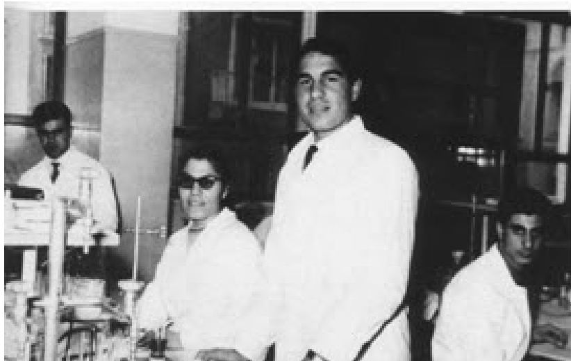
Στο εργαστήριο Φυσικής στο Πανεπιστήμιο Αθηνών.