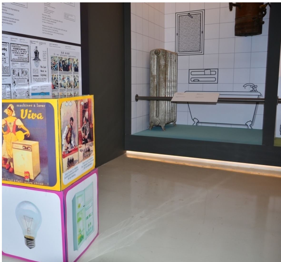
Συσκευές φωταερίου και ηλεκτρισμού

ανακαλύψουν με τη βοήθεια της φωτογραφίας, της μνήμης και της παρατηρητικότητας, της παντομίμας και της διάδρασης τα μυστικά και τη λειτουργία ενός εργοστασίου φωταερίου. Τα παιδιά και οι συνοδοί τους τοποθετούν σε ένα χάρτη της Ελλάδας, εργοστάσια και βιομηχανίες διαφόρων προϊόντων. Αντιστοιχούν συσκευές που λειτουργούσαν με φωταέριο με σύγχρονες οικιακές συσκευές. Συμμετέχουν ενεργά σε μια πρωτότυπη δραστηριότητα, με θέμα τις πηγές και τις νέες μορφές ενέργειας. Ανακαλύπτουν τα παραπροϊόντα που προέκυπταν από τον καθαρισμό του αερίου και τις χρήσεις τους. Γνωρίζουν τα επαγγέλματα του παλαιού εργοστασίου φωταερίου της Αθήνας, συμμετέχοντας σε παιχνίδι εξερεύνησης και αναζήτησης μέσα στους χώρους του μουσείου.