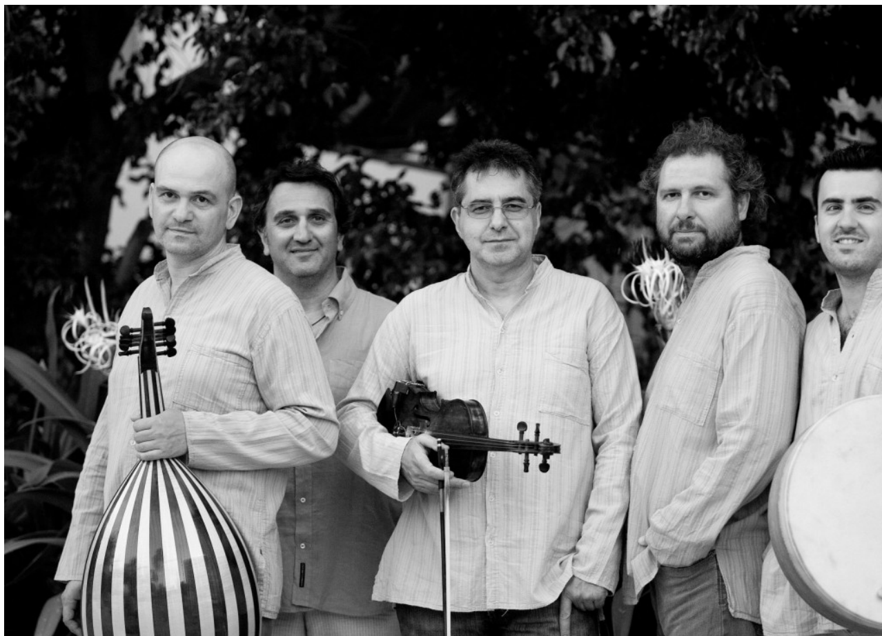
Εν Χορδαίς, Φωτο Ελένη Παπαδοπούλου