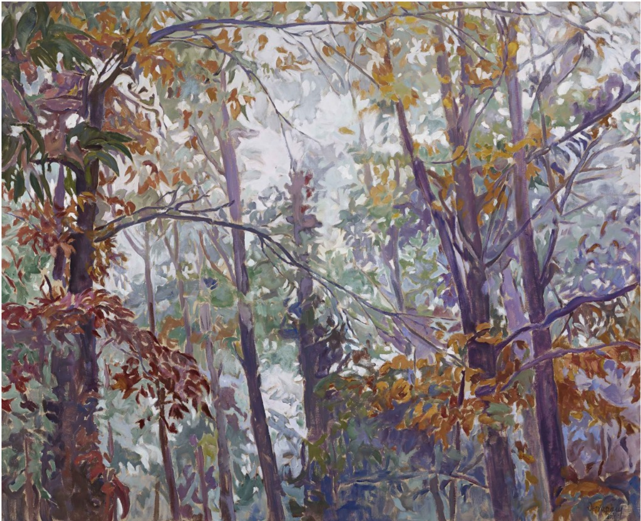
Δάσος, λάδι σε μουσαμά, 130x160, εκ.2011

το βραβείο Order of the Rising Sun with Neck Ribbon από τον Αυτοκράτορα της Ιαπωνίας. Το 2007 ίδρυσε το κοινωφελές «Ίδρυμα Εικαστικών Τεχνών και Μουσικής Βασίλη και Μαρίνας Θεοχαράκη», το οποίο στεγάζεται στο πολυώροφο κτίριο της οδού Βασιλίσσης Σοφίας 9, στην Αθήνα.