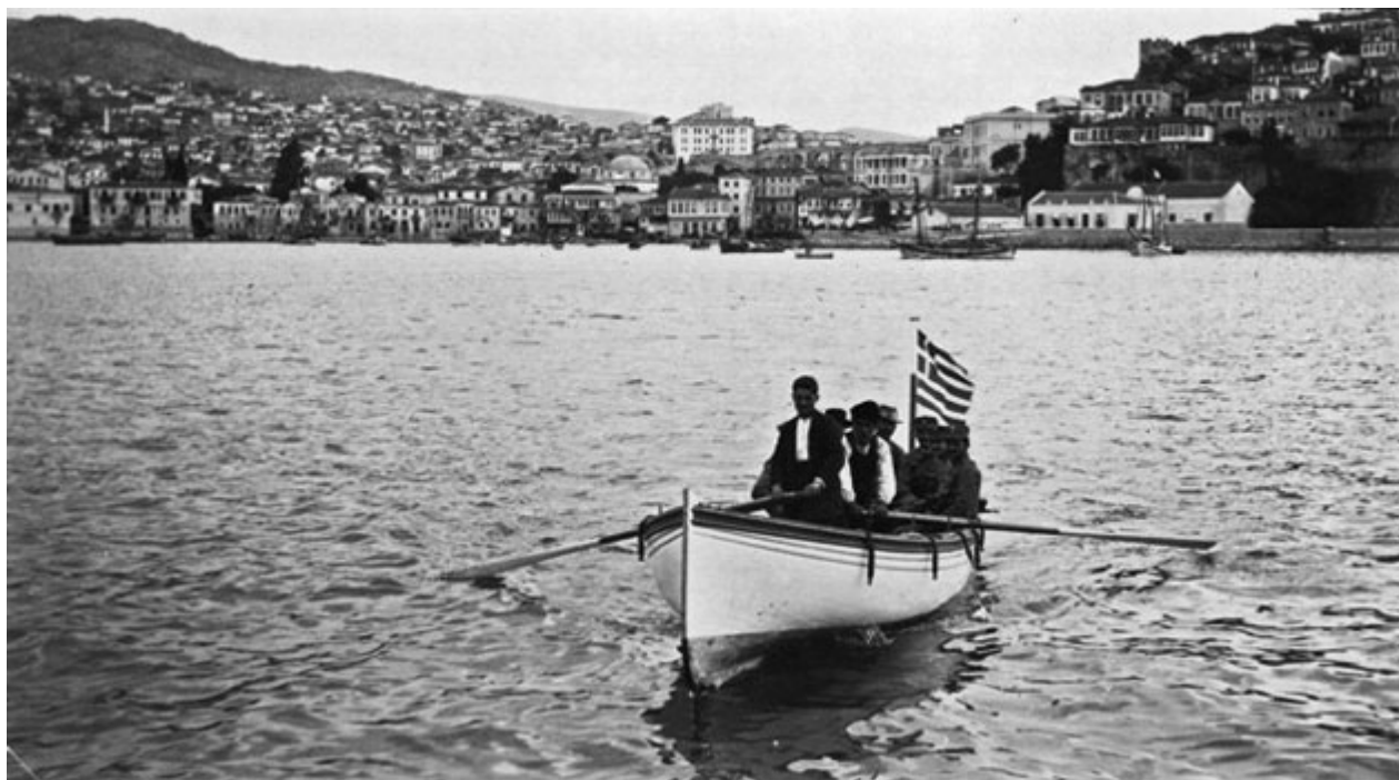
Καβάλα, λίγο μετά την απελευθέρωσή της στις 26 Ιουνίου 1913. Α.Σ.Κ.Σ.Α- Γεννάδειος Βιβλιοθήκη.

Η ιστορία των Νέων Χωρών δηλαδή της Ηπείρου, της Μακεδονίας, της Θράκης των νησιών του Βορείου Αιγαίου, της Σάμου, και της Κρήτης εναρμονίστηκε επιτέλους με την εθνική.