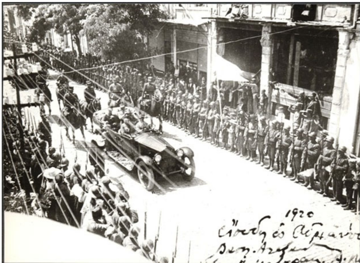
Δεδέαγατς (Αλεξανδρούπολη), 13 Ιουλίου 1920. Ο βασιλιάς Αλέξανδρος φτάνει στην πόλη. Εθνικό Ιστορικό Μουσείο.

Ο απαιτήσεις σε δημόσιους υπαλλήλους όλων των ειδικοτήτων ήταν τεράστιες. Η υπάρχουσα οργάνωση στις περισσότερες περιπτώσεις ήταν ασύμβατη με την ελληνική. Ακόμη σημαντικότερο ζητούμενο ήταν η επιτυχής διοίκηση ενδεχομένως απρόθυμων αλλοφώνων και αλλοθρήσκων. Και όλα αυτά εν μέσω ενός παγκοσμίου πολέμου και μιας συγκλονιστικής πολιτικής κρίσης που έθεταν σε αμφιβολία όχι μόνο τη διατήρηση των κατακτημένων εδαφών αλλά και την καθημερινή επιβίωση των νέων υπηκόων. Εκ των υστέρων γνωρίζουμε πως η πορεία της ενσωμάτωσης θα άφηνε σημάδια ορατά για πολλές δεκαετίες μέχρι σήμερα.