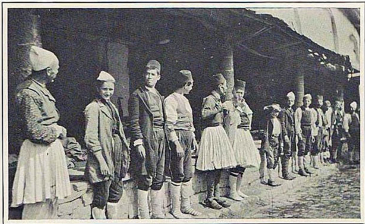
A GROUP OF ALBANIANS.