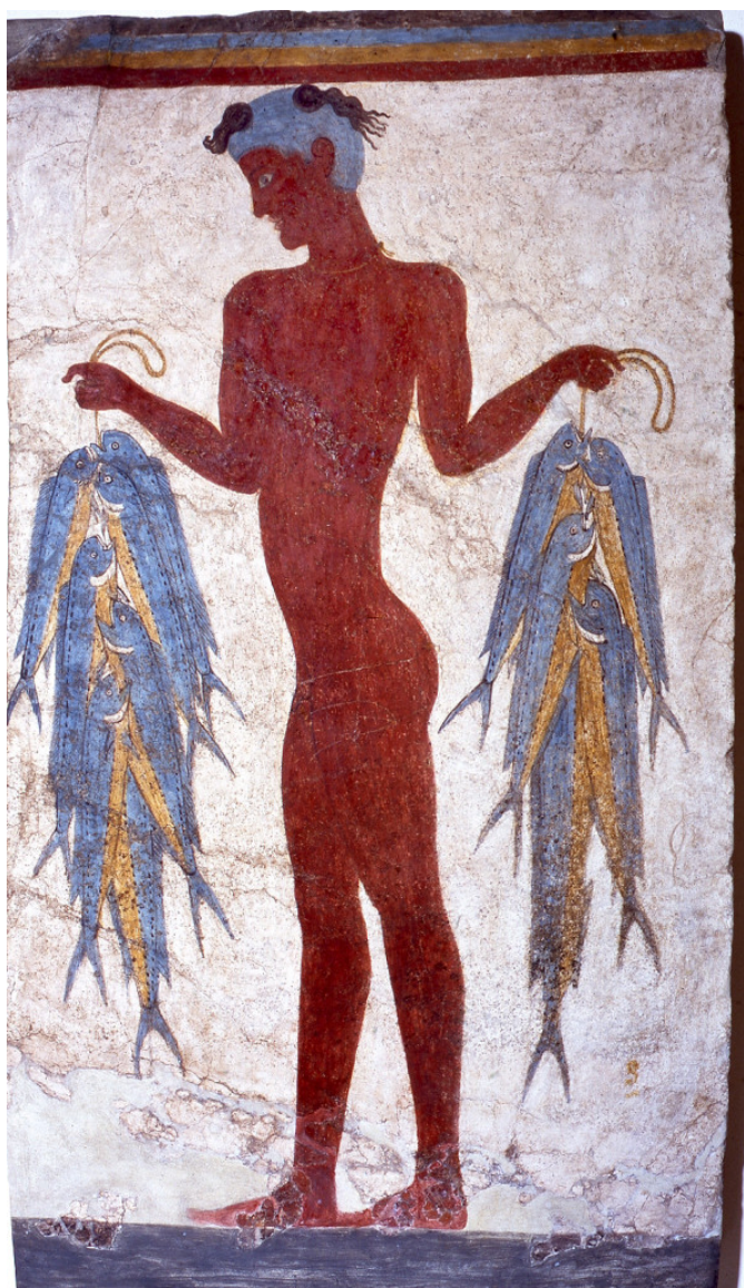
Τοιχογραφία ψαρά από το Ακρωτήριο της Θήρας, 1600-1500

Η έκθεση συνοδεύεται από ειδικά σχεδιασμένο κατάλογο, ο οποίος θα κυκλοφορήσει πρώτα στις Βρυξέλλες και έπειτα στην Αθήνα, προλογίζεται δε από τον Πρωθυπουργό Αντώνη Σαμαρά: