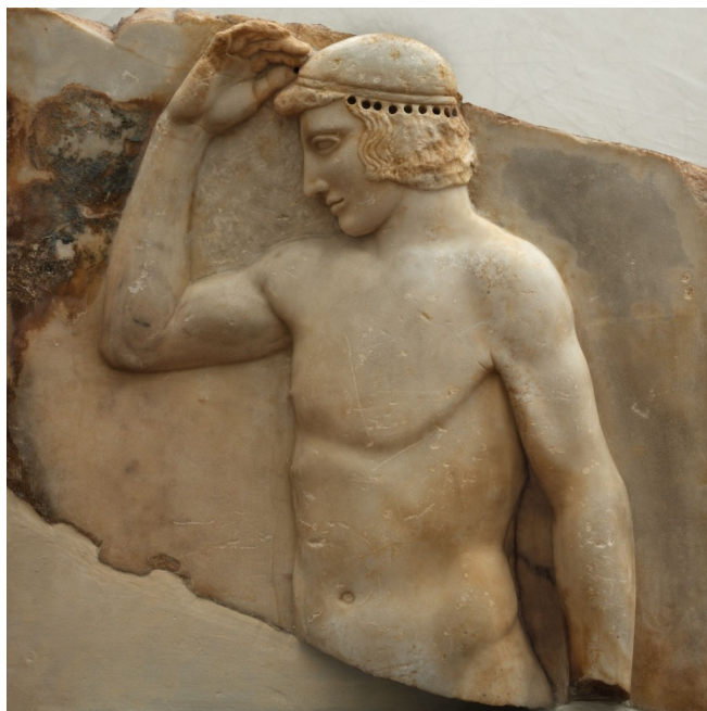
Αναθηματικό ανάγλυφο με παράσταση νέου αθλητή που αυτοστεφανώνεται στο Σούνιο, π.460

«Ναυτίλος: Ταξιδεύοντας την Ελλάδα», είναι ο τίτλος της έκθεσης που αποτελεί μία από τις βασικές πολιτιστικές εκδηλώσεις της Ελληνικής Προεδρίας της Ευρωπαϊκής Ένωσης, η οποία θα φιλοξενηθεί στο περίφημο Μουσείο Bozar των Βρυξελλών, από την αύριο Πέμπτη έως τις 24 Απριλίου.