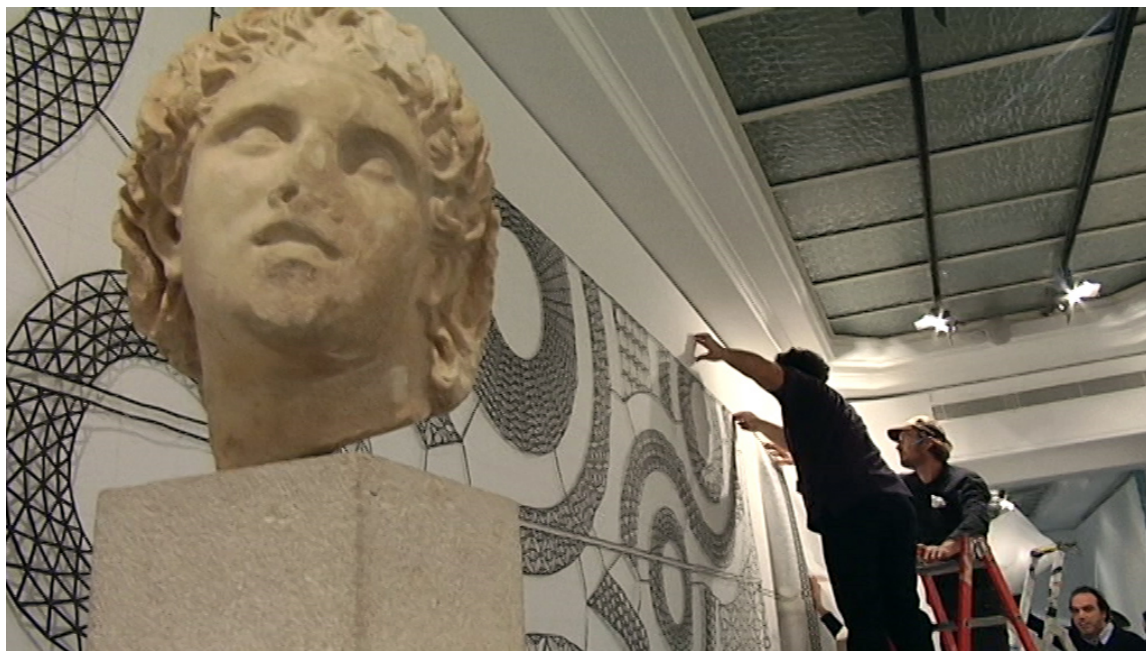
Φωτογραφία από την ετοιμασία της έκθεσης