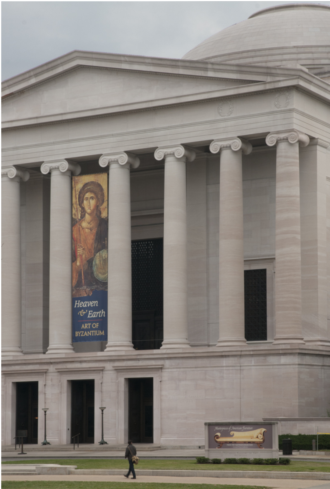
Εθνική Πινακοθήκη της Ουάσιγκτον

Μετά την Ουάσιγκτον στο Λος Άντζελες. Η έκθεση «Ουρανός και Γη. Η τέχνη του Βυζαντίου από Ελληνικές συλλογές», μεταφέρεται στη Βίλα Γκετί, στο Λος Άντζελες. Στις 8 Απριλίου θα γίνουν -σύμφωνα με πληροφορίες- τα επίσημα εγκαίνια, από τον Υπουργό Πολιτισμού και Τουρισμού Πάνο Παναγιωτόπουλο.