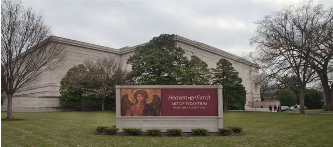
«Ουρανός και Γη»