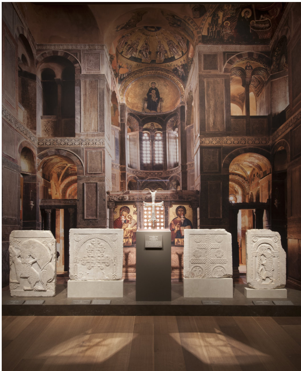
Αίθουσα αρ. 2 της έκθεσης

Στη Βίλα Γκετί του Μουσείου Ζαν Πολ Γκετί στο Μαλιμπού, θα εκτεθούν τα περισσότερα έργα και στο Κέντρο Γκετί τα χειρόγραφα. Η έκθεση θα διαρκέσει στο Λος Αντζελες έως τις 25 Αυγούστου, για να μεταφερθεί κατόπιν στο Σικάγο, στο περίφημο Art Institute, ένα από τα σημαντικότερα διεθνή κέντρα της πόλης, όπου θα εγκαινιαστεί εντός τού Σεπτεμβρίου.