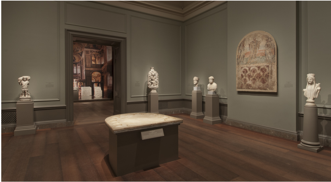
Αίθουσα αρ. 1 της έκθεσης

Πρόκειται για μία πολύ σημαντική έκθεση, καθώς την επισκέφθηκαν - στην Εθνική Πινακοθήκη της Ουάσιγκτον- περίπου 200 χιλιάδες άνθρωποι από τις ΗΠΑ αλλά και πολλές άλλες χώρες. Είναι χαρακτηριστικό ότι οι κατάλογοι από τα πωλητήρια του μουσείου εξαντλήθηκαν, ενώ υπήρξαν πολλά επαινετικά δημοσιεύματα.