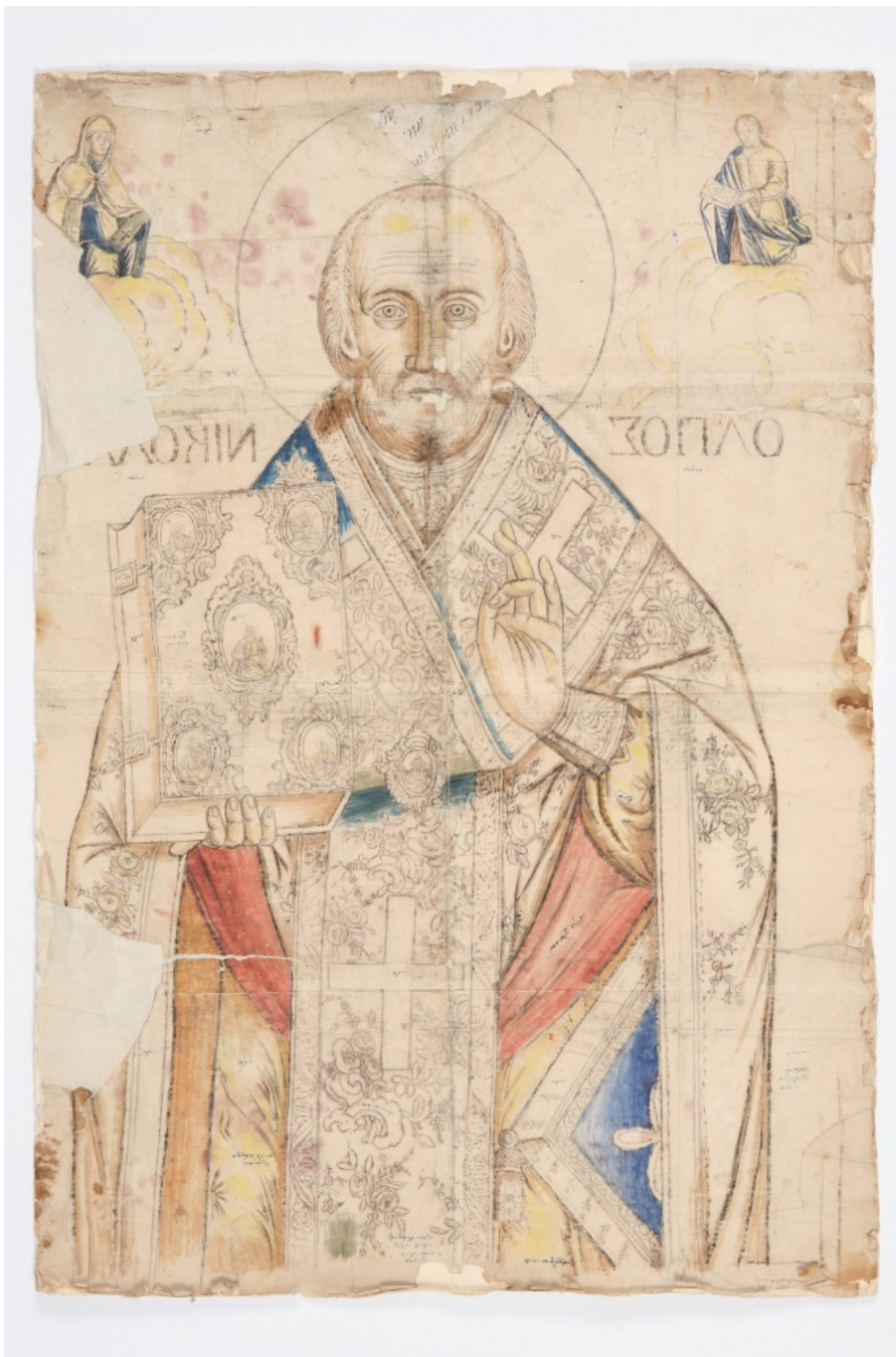
Ο Αγ. Νικόλαος, αρχές 19ου αι.

περισσότερο τη φόρμα παρά το χρώμα. Και θα ήταν λάθος να το εντάξουμε ανάμεσα στα δεκάδες προπαρασκευαστικά σκίτσα αναλογικά με τις προπαρασκευαστικές σπουδές που συχνά προηγούνται μέχρι την ολοκλήρωση ενός έργου ζωγραφικής, αν σκεφτούμε ότι οι αρχές της ισορροπίας, της συμμετρίας, της αξονικότητας, της ιεράρχησης, του ρυθμού και της αναλογίας, όσο πάμε πίσω στο χρόνο, αποτυπώνονται καθαρά και με σαφήνεια πάνω στο σκληρό γραμμικό σχέδιο του αντιβόλου, από το οποίο συνήθως απουσιάζει η χρωματική ένταση. Αυτοί, άλλωστε, οι νόμοι αποτελούσαν τα διαπιστευτήρια του καλού τεχνίτη που αναλάμβανε να αποτυπώσει τη θεολογία της εικόνας».