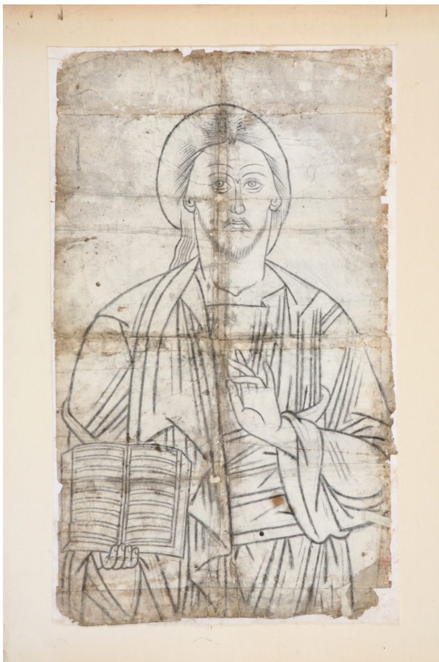
Χριστός Παντοκράτωρ, τέλη 18ου-αρχές 19ου αι.

Τι είναι όμως το Ανθίβολο; Η λέξη ανθίβολο, από το ρήμα αντιβάλλω, είναι το χνάρι, το αποτύπωμα ενός εικαστικά αξιόλογου αρχετύπου και μνημονεύεται για πρώτη φορά σε κρητικό έγγραφο του 1560 (Μ. Βασιλάκη, 1995).