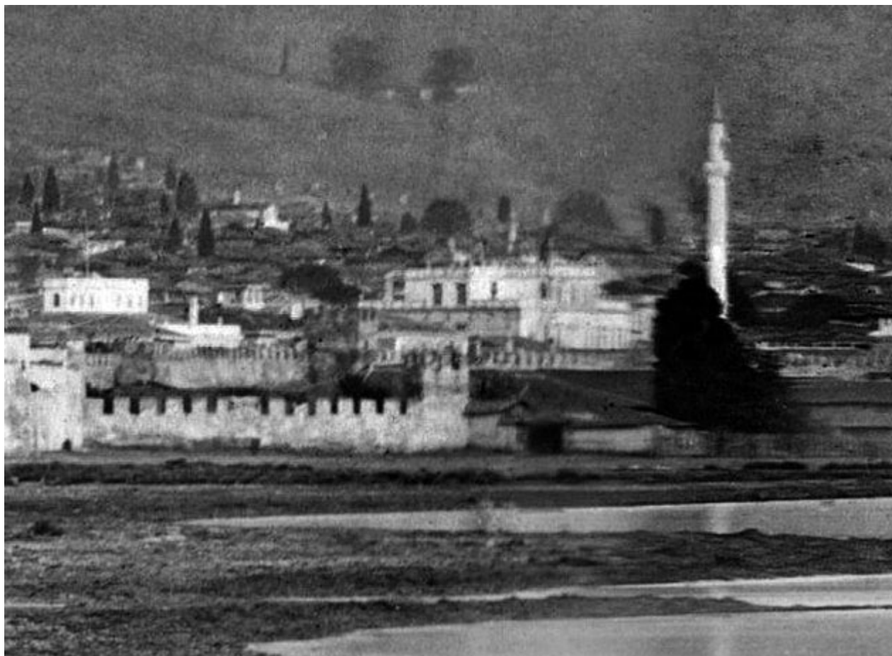
1863: ο Πύργος της Αποβάθρας, πίσω από τις δύο ανατολικότερες αποθήκες του λιμανιού.

Στο πλαίσιο της έκθεσης έχουν προγραμματιστεί ξεναγήσεις και διαλέξεις γύρω από την ιστορία των δύο παλαιότερων πανοραμικών φωτογραφιών της Θεσσαλονίκης, των μνημείων και της πόλης του 19ου αιώνα.