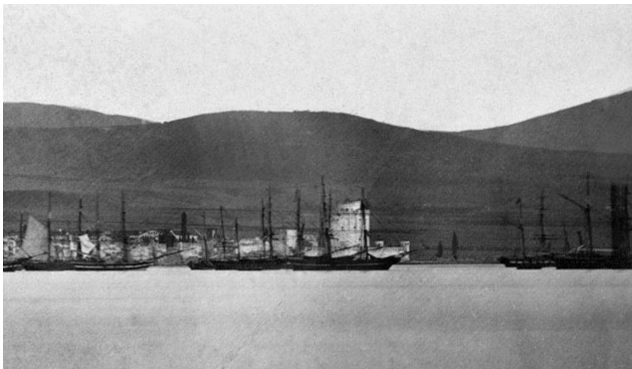
1863: ο Λευκός Πύργος και τα θαλάσσια τείχη, μισοκρυμμένα πίσω από τα ιστιοφόρα.

δημόσιων κτιρίων και αστικών κατοικιών) στην οθωμανική πόλη των μέσων του 19ου αιώνα. Συγκρίνονται οι αλλαγές ανάμεσα σε αυτή και στη δεύτερη αρχαιότερη φωτογραφία του 1875-78, (εκείνη του αρχείου Δέλλιου που απόκειται στο ΕΛΙΑ-ΜΙΕΤ, που έχει ήδη παρουσιαστεί στην έκθεση Η Δύση της Ανατολής το 2012-13). Στη νεότερη αυτή φωτογραφία -που επίσης εκτίθεται προς σύγκριση- τα θαλάσσια τείχη έχουν κατεδαφιστεί και νέα κτίρια, όπως το πρώτο Δημαρχείο του 1869, έχουν ανεγερθεί.