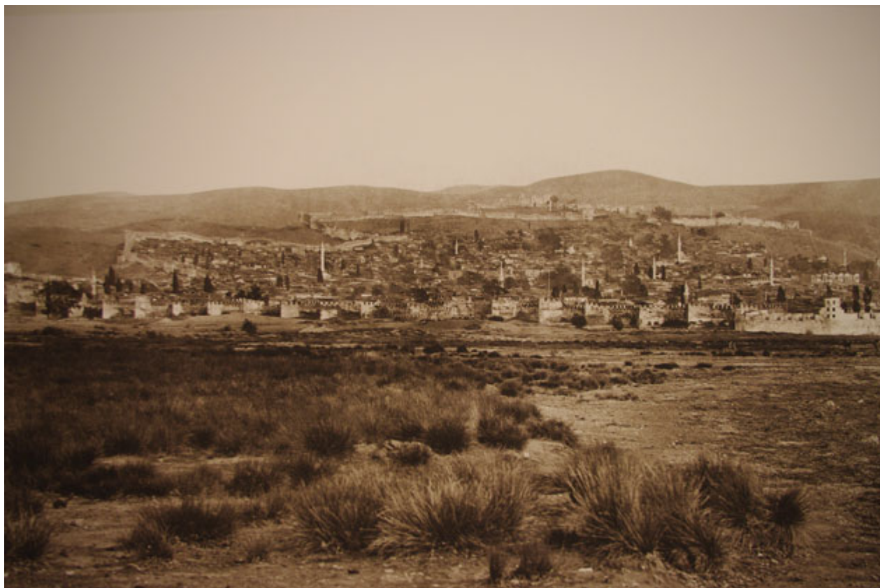
Λεπτομέρεια της φωτογραφίας του 1863

Οι ξεναγήσεις θα πραγματοποιούνται κάθε Τετάρτη στις 18.00 και κάθε Κυριακή στις 11.00.