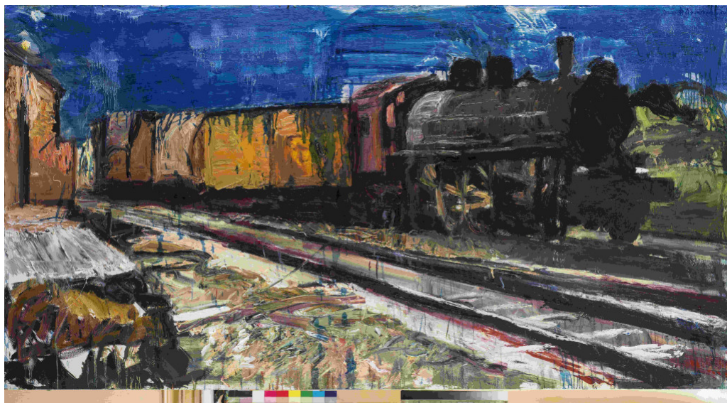
Φραγκίσκος Δουκάκης, 125x245cm

Ο επισκέπτης της έκθεσης θα δει τριάντα έργα, όλα λάδι σε μουσαμά, μικρών και μεγάλων διαστάσεων που αποτυπώνουν αναμνήσεις της παιδικής του ηλικίας, εικόνες από το παρελθόν, ή όπως λέει ο ίδιος, ό,τι έβλεπε μετά το σχολείο όταν μαζευόντουσαν για παιγνίδι ή απογευματινές βόλτες.