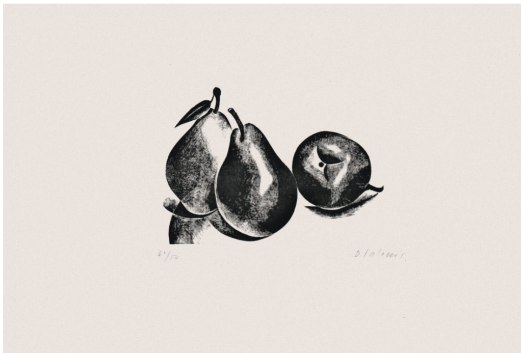
Quatre Natures-Mortes, Dont une D' Apres Picasso

Η έρευνα ξεκίνησε το 2008 στην Αθήνα και το Παρίσι και έως το 2013 είχε ολοκληρωθεί η καταγραφή των 152 τίτλων, δηλαδή των βιβλίων, λευκωμάτων και εντύπων που εικονογράφησε ο καλλιτέχνης στο διάστημα 1904-1962. Αποτέλεσμα αυτής της έρευνας αποτελεί η έκδοση, την οποία ανέλαβε το ΜΙΕΤ, ενός αναλυτικού καταλόγου με τίτλο «Δημήτρης Γαλάνης. Τα εικονογραφημένα βιβλία, 1904-1962». Η έκθεση εμπλουτίζεται με έργα ζωγραφικής, σχέδια, χαρακτηριστικά κ.ά. που προέρχονται από ιδιωτικές συλλογές, μουσεία, ιδρύματα κτλ.