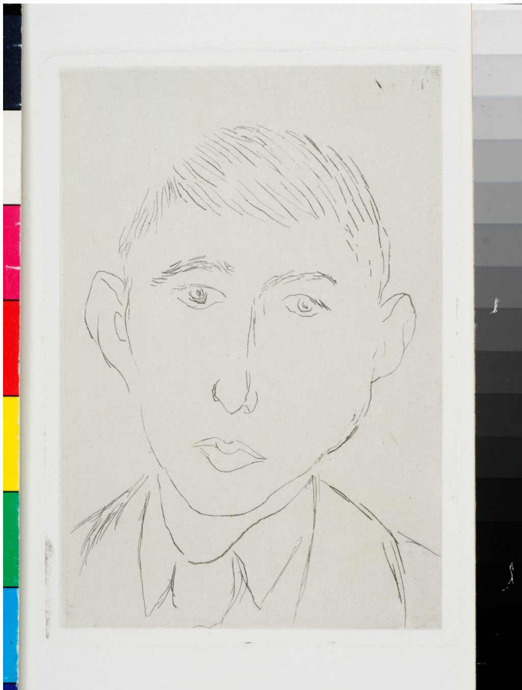
Herni Matisse, D. Galanis, Payan, 1914

Έως το 1929 ο Γαλάνης έχει διαμορφώσει το προσωπικό του στίγμα. Πρόκειται για τη δεκαετία της αναγνώρισης (1920-1930) και τη σταδιακή στροφή του σε επιρροές από παρελθόντες αιώνες. Ο Γαλάνης καταστάλαξε σε ένα προσωπικό ύφος με προσεκτικές επιλογές από το παρόν, αλλά περισσότερα στοιχεία από το παρελθόν και ως προς τα μοτίβα και ως προς το σχεδιασμό του βιβλίου. Η ασχολία του με την εικονογράφηση βιβλίων ήταν ο βασικός βιοπορισμός του και μέσα από αυτά έγινε πολύ γνωστός στους βιβλιόφιλους, αλλά και στο κοινό του Παρισιού που ακόμα και σήμερα γνωρίζει τον «Galanis». Συγκαταλέγεται ανάμεσα στους σημαντικότερους αμιγείς χαρακτες του 20ού αιώνα. Για τις εκδόσεις των βιβλίων του συνεργάστηκε με συγγραφείς όπως ο Μαλρώ, ο Νερβάλ, ο Γκαμπορύ, ο