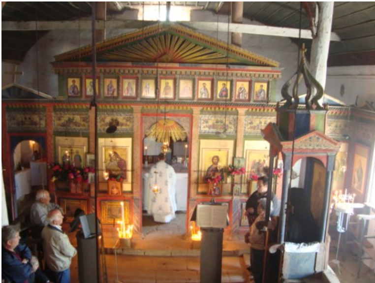
Στην Ίμβρο, φωτό 3

ευλογία του να βοηθήσουμε στην οργάνωσή της, πράγμα που έγινε. Εργαστήκαμε ιδιαίτερα ως επιτροπή στο θέμα της προβολής της εκδήλωσης. Ευελπιστούμε ότι στο άμεσο μέλλον θα οργανωθούν και άλλες εκδηλώσεις για τον ίδιο σκοπό, που θα θέλαμε να τεθούν υπό την αιγίδα της Ιεράς Συνόδου.