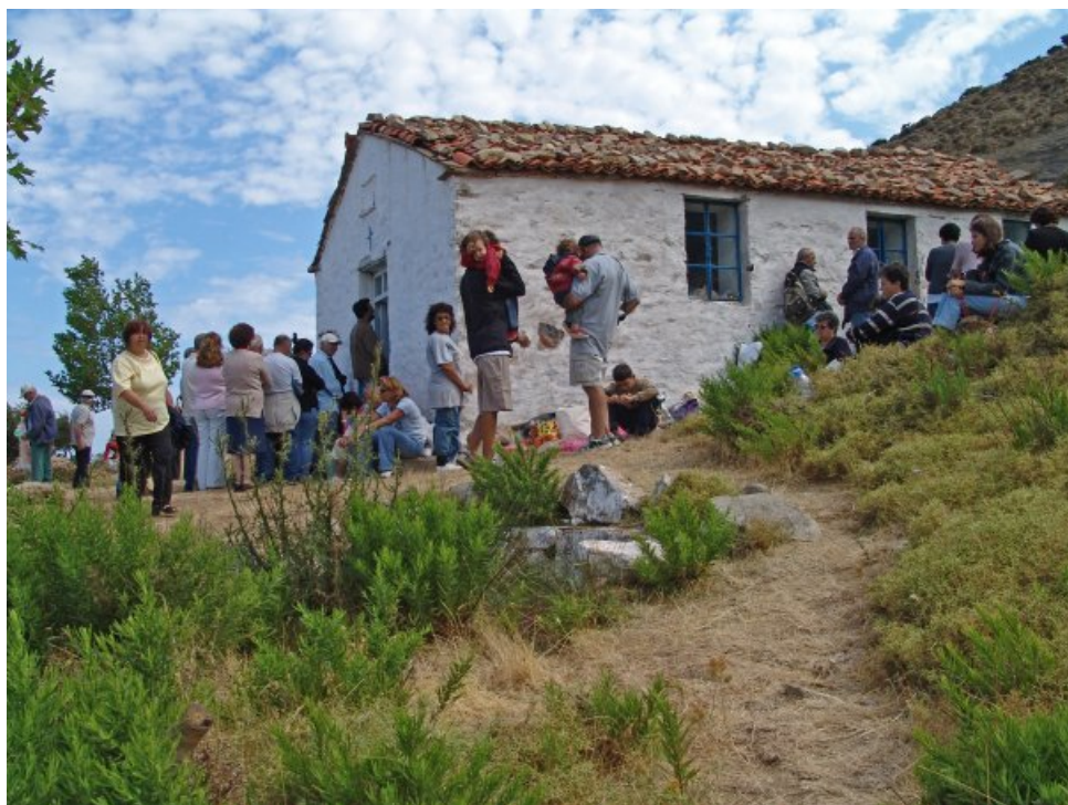
Στην Ίμβρο, φωτο 4

Πεμπτουσία: Θα μπορούσε να πει κανείς ότι ο σκοπός της εκδήλωσης είναι διττός: Καλλιτεχνικός και πατριωτικός; Παρεξηγημένες έννοιες και οι δύο στις μέρες μας.