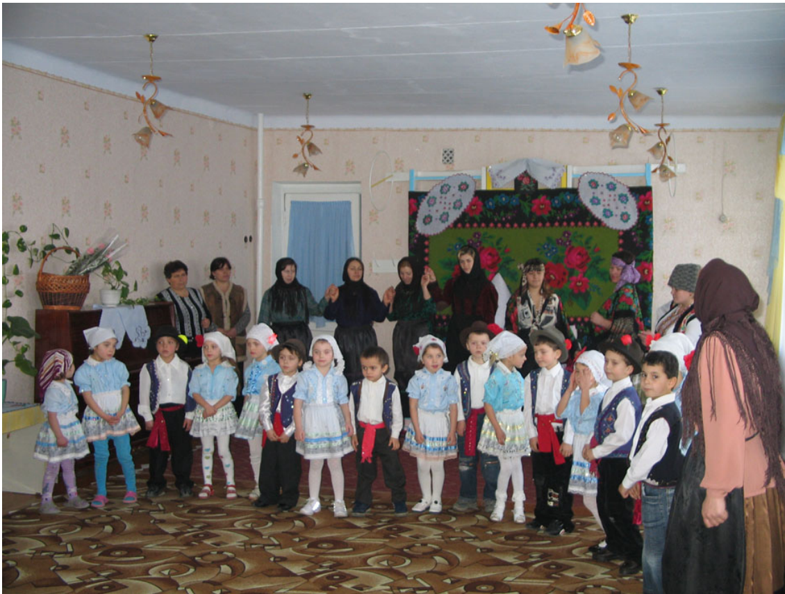
Πολιτιστικές εκδηλώσεις σε δημοτικό σχολείο - νηπιαγωγείο των Γκαγκαούζων.

Αξίζει να σημειωθεί ότι οι θεωρίες αυτές δεν υποστηρίζονται από την σύγχρονη δυτική ιστοριογραφία. Συναντώνται κυρίως στην σοβιετική, τουρκική και εν μέρει βουλγαρική βιβλιογραφία. Ειδικά η θεωρία για την καταγωγή των Γκαγκαούζων από τους Τουρανούς Πρωτοβουλγάρους απαντάται μόνον στην βουλγαρική βιβλιογραφία για συγκεκριμένους πολιτικούς λόγους.