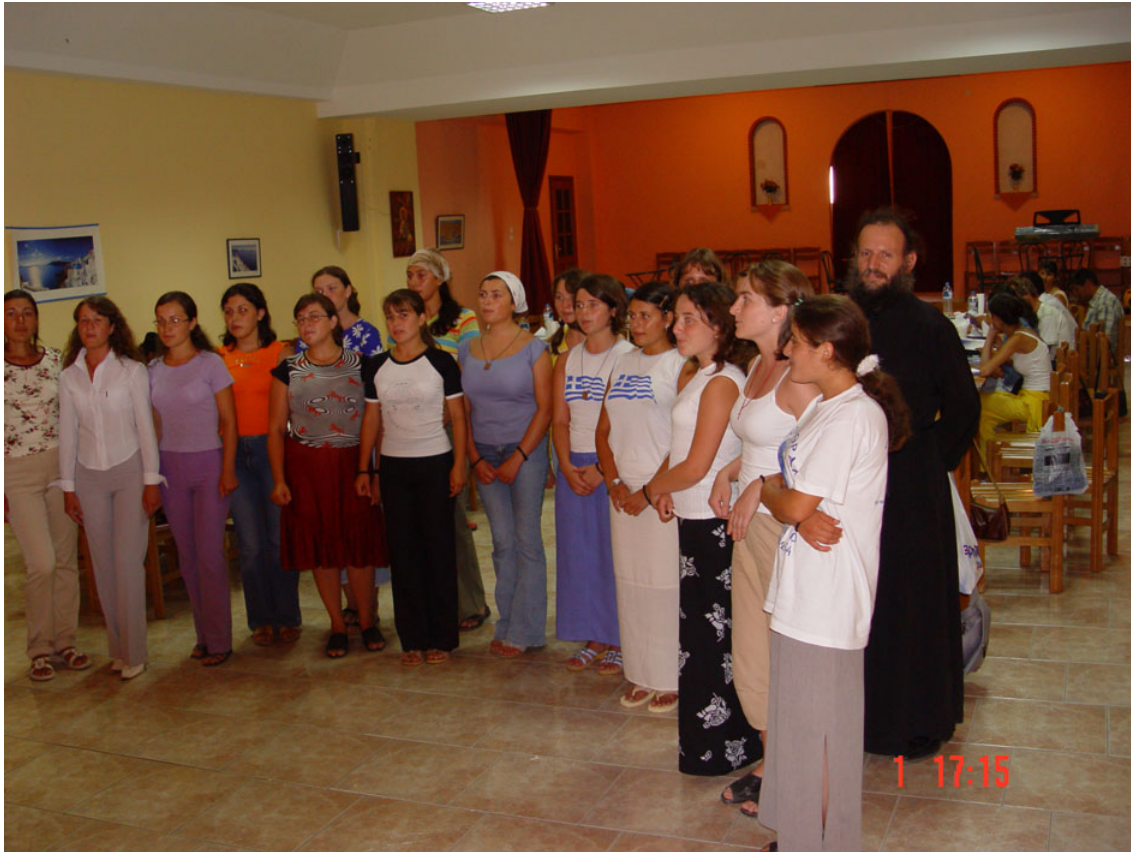
Στιγμιότυπο από παλαιότερη επίσκεψη παιδιών από τη Γκαγκαουζία στην Ελλάδα.

Η συστηματική έρευνα σε στοιχεία των δύο τελευταίων θεωριών θα ήταν η καλύτερη μέθοδος για την αναζήτηση της αλήθειας.