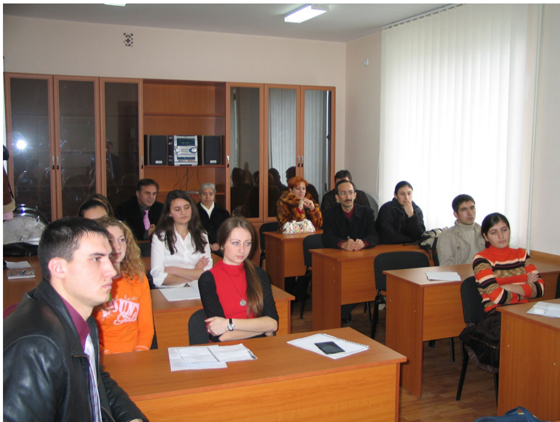
Μεγάλο ενδιαφέρον δείχνουν οι φοιτητές για τη διδασκαλία της ελληνικής γλώσσας στο Πανεπιστήμιο του Κομράτ.