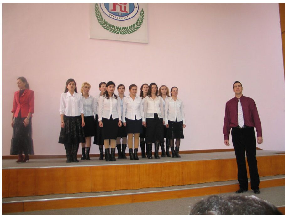
Πολιτιστικές εκδηλώσεις στο Πανεπιστήμιο του Κομράτ.

Ο κύριος λόγος για τον οποίον προτάθηκαν αυτές οι θεωρίες είναι το ότι οι Γκαγκαούζοι μιλάνε μία γλώσσα της τουρανικής οικογένειας γλωσσών. Με μία προσεκτική «ματιά» όμως θα αντιληφθούμε ότι οι Γκαγκαούζοι μιλάνε μία καθαρά ανατολίτικης προέλευσης τουρκική διάλεκτο. Οι γλώσσες που μιλούσαν οι προαναφερθέντες λαοί ήταν πιο κοντά στα σημερινά Τατάρικα, τα οποία απέχουν από τις τουρκικές διαλέκτους της Ανατολίας όσο τα Ισπανικά από τα Ιταλικά και τα Γερμανικά από τα Νορβηγικά. Επομένως, αν οι Γκαγκαούζοι έλκουν την καταγωγή τους από τους προαναφερθέντες λαούς, τότε σίγουρα έχουν χάσει την γλώσσα τους και οικειοποιήθηκαν τα Τουρκικά της Ανατολίας. Συνεπώς η γλώσσα δεν αποτελεί ένδειξη για την καταγωγή τους από τους λαούς αυτούς. Τέλος, το σύνολο των πολιτιστικών και πολιτισμικών στοιχείων, καθώς και τα φυσιογνωμικά χαρακτηριστικά των Γκαγκαούζων, δεν είναι ικανά να μας δώσουν έστω και ενδείξεις ώστε να αναζητήσουμε κάποια σχέση τους με τους λαούς που αναφέραμε προηγουμένως.