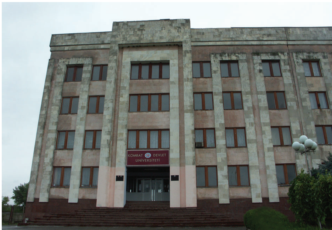
Το Πανεπιστήμιο του Κομράτ.

γκαγκαουζική συνείδηση. Οι υπόλοιποι (20.000-30.000) ζουν κυρίως στην Ν.Α. Ουκρανία, στην περιοχή της Αζοφικής Θάλασσας, στον Ρωσικό Καύκασο, στο Καζακστάν, στο Ουζμπεκιστάν κ.α. Είναι κυρίως απόγονοι μεταναστών από την Μολδαβία οι οποίοι εγκαταστάθηκαν εκεί κατά τα τέλη του 19ου και στις αρχές του 20ου αιώνα.