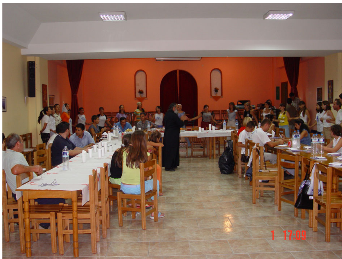
Στιγμιότυπο από παλαιότερη επίσκεψη παιδιών από τη Γκαγκαουζία στην Ελλάδα.

Εξαιρέση αποτελούν αυτοί της περιοχής Νέας Ζίχνης, οι οποίοι θεωρούνται -λόγω της πολύχρονης παρουσίας τους- ντόπιοι.