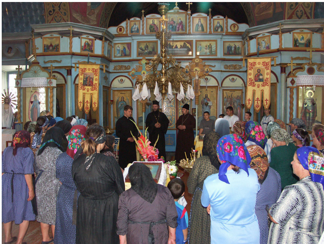
Στιγμιότυπο από επίσκεψη του Συνδέσμου Φίλων της Γκαγκαουζίας σε εκκλησίες της Γκαγκαουζίας.

Μέχρι και την δεκαετία του 1980 δεν είχαμε ουσιαστικές αλλαγές και η κατάσταση παρέμεινε όπως περιγράφηκε στην προηγούμενη παράγραφο. Η περεστρόικα και η επακολουθήσασα διάλυση της ΕΣΣΔ δρομολόγησαν εκ νέου τις διαδικασίες αναζήτησης της εθνικής ταυτότητας σε πολλούς λαούς, μεταξύ των οποίων και οι Γκαγκαούζοι της Μολδαβίας και της Ουκρανίας. Την χρονική αυτή περίοδο, η σκυτάλη των εξελίξεων περνάει στα χέρια της Τουρκίας.