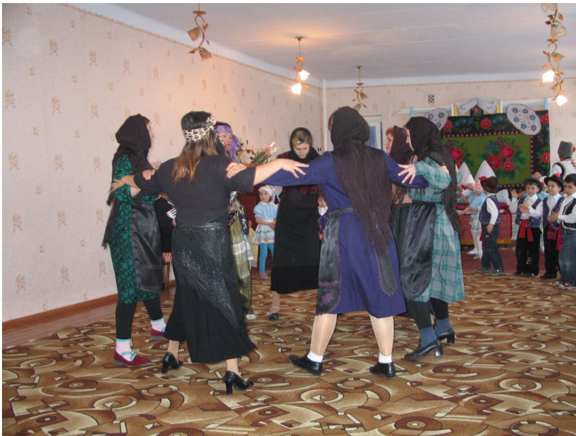
Πολιτιστικές εκδηλώσεις σε δημοτικό σχολείο - νηπιαγωγείο των Γκαγκαούζων.

Ο Wittek -με την χρήση σελτζουκικών, οθωμανικών και βυζαντινών πηγών- απέδειξε, σε ικανοποιητικό βαθμό, ότι οι Γκαγκαούζοι έλκουν την καταγωγή τους από τους ανθρώπους του Kaikaus και το εθνώνυμό τους είναι παράφραση του ονόματός του. Την επόμενη δεκαετία, η Ελληνίδα μαθήτρια του Wittek Ελισάβετ Ζαχαριάδου, με χρήση βυζαντινών πηγών, κυρίως χρυσόβουλων της Ιεράς Μονής Βατοπαιδίου, επιβεβαίωσε την θεωρία αυτή. Από τότε η δυτική βιβλιογραφία εν γένει αποδέχεται την θεωρία αυτή ως την επικρατέστερη για την προέλευση των Γκαγκαούζων. Το ουσιαστικό όμως πρόβλημα της θεωρίας αυτής είναι ότι δεν διασαφηνίζει το ποιοί ήταν οι άνθρωποι που ακολούθησαν τον Kaikaus. Ο Wittek, χωρίς να το καλοσκεφτεί, θεώρησε δεδομένο ότι, αφού οι άνθρωποι αυτοί ήταν από τα εδάφη του σελτζουκικού σουλτανάτου, άρα ήταν και Τούρκοι. Το γεγονός αυτό, όπως παραδέχεται και ο ίδιος, δημιουργεί ορισμένα παράδοξα και ασύμβατα σημεία στην όλη θεωρία του. Από τότε κανένας άλλος ερευνητής δεν μπόρεσε να ασχοληθεί με το ερώτημα αυτό.