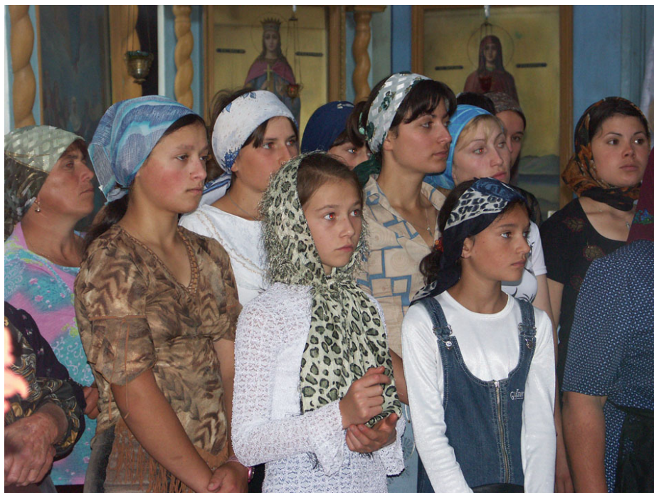
Στιγμιότυπο από επίσκεψη του Συνδέσμου Φίλων της Γκαγκαουζίας σε εκκλησίες της Γκαγκαουζίας.

Για ποιό λόγο, λοιπόν, θα πρέπει να υποθέσουμε ότι οι κεντροασιατικοί-τουρανικοί αυτοί λαοί του Μεσαίωνα εγκατέλειψαν όλα εντελώς τα εθνικά τους χαρακτηριστικά και μετασχηματίστηκαν σε κάτι διαφορετικό;