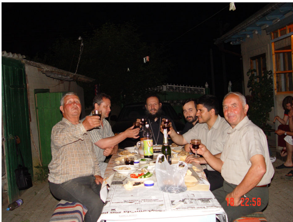
Από την καθημερινότητα των Γκαγκαούζων.