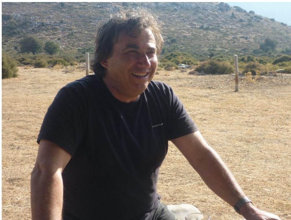
Λουδοβίκος των Ανωγείων, 8-11-2011

Στην Πεμπτουσία, μίλησε για τα Υακίνθεια 2014, με θέμα: Οι «ήρωες» του Ερωτόκριτου, ο Λουδοβίκος των Ανωγείων.