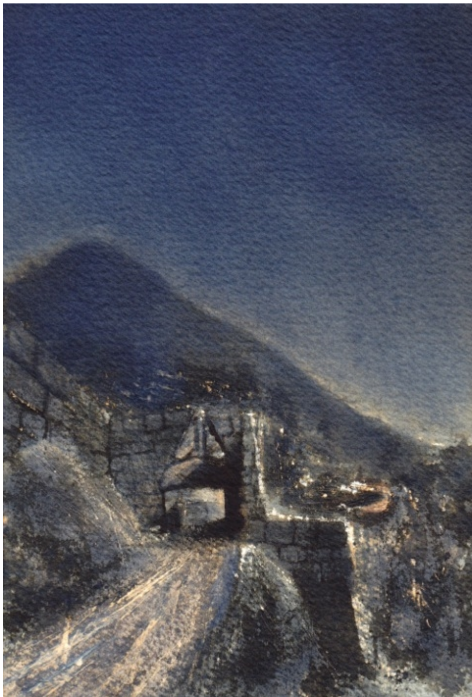
Έργο του Γεωργιάδη

Ο Πausanias, Έλληνας ή εξελληνισμένος Λυδός που έτρεφε βαθύ σεβασμό και θαυμασμό προς τον Αρχαίο Ελληνικό Πολιτισμό, έζησε τον 2ο αιώνα μ.Χ. Υπήρξε περιηγητής και συγγραφέας περιηγητικών κειμένων, ο οποίος παρέδωσε στην ανθρωπότητα το δεκάτομο έργο του «Ελλάδος Περιήγησις», που σώζεται ολόκληρο αποτελώντας πολύτιμη πηγή αρχαιογνωσίας, καθώς καταγράφει και διασώζει τα μνημεία της ελληνικής αρχαιότητας στο σύνολό τους. Αγάλματα, πίνακες, τάφοι, ναοί, παραδόσεις, έθιμα και προϊόντα, όλα περνούν από το βλέμμα και την εξαιρετική πένα του Pausanias, που με μοναδικό ύφος αποδίδει την