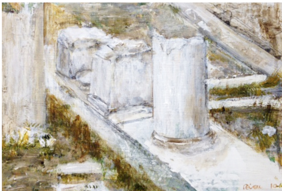
Έργο του Παπαδάκη

Η έκθεση, η οποία παρουσιάστηκε για πρώτη φορά στην Αίθουσα Τέχνης Ιανός, από τις 3 Ιουνίου έως τις 12 Ιουλίου 2014, μεταφέρεται στο Ιστορικό και Λαογραφικό Μουσείο του Δήμου Αίγινας, από τις 18 έως τις 30 Ιουλίου.