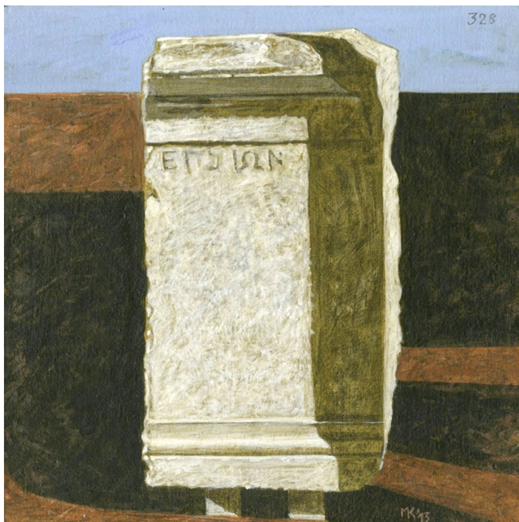
Έργο του Καμπάνη

πραγματικότητα του ελληνικού χώρου και μαρτυρά την ελληνική ζωή της κλασικής εποχής.