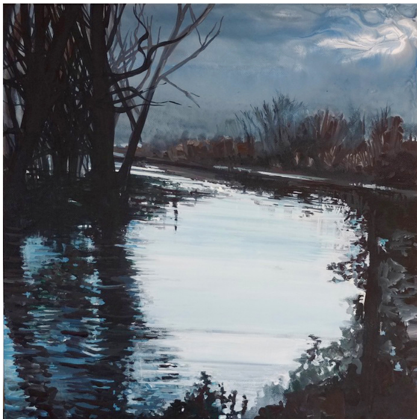
Έργο του Σαλταφέρου

Η έκθεση, η οποία παρουσιάστηκε για πρώτη φορά στην Αίθουσα Τέχνης Ιανός, από τις 3 Ιουνίου έως τις 12 Ιουλίου 2014, μεταφέρεται στο Ιστορικό και Λαογραφικό Μουσείο του Δήμου Αίγινας, από τις 18 έως τις 30 Ιουλίου.