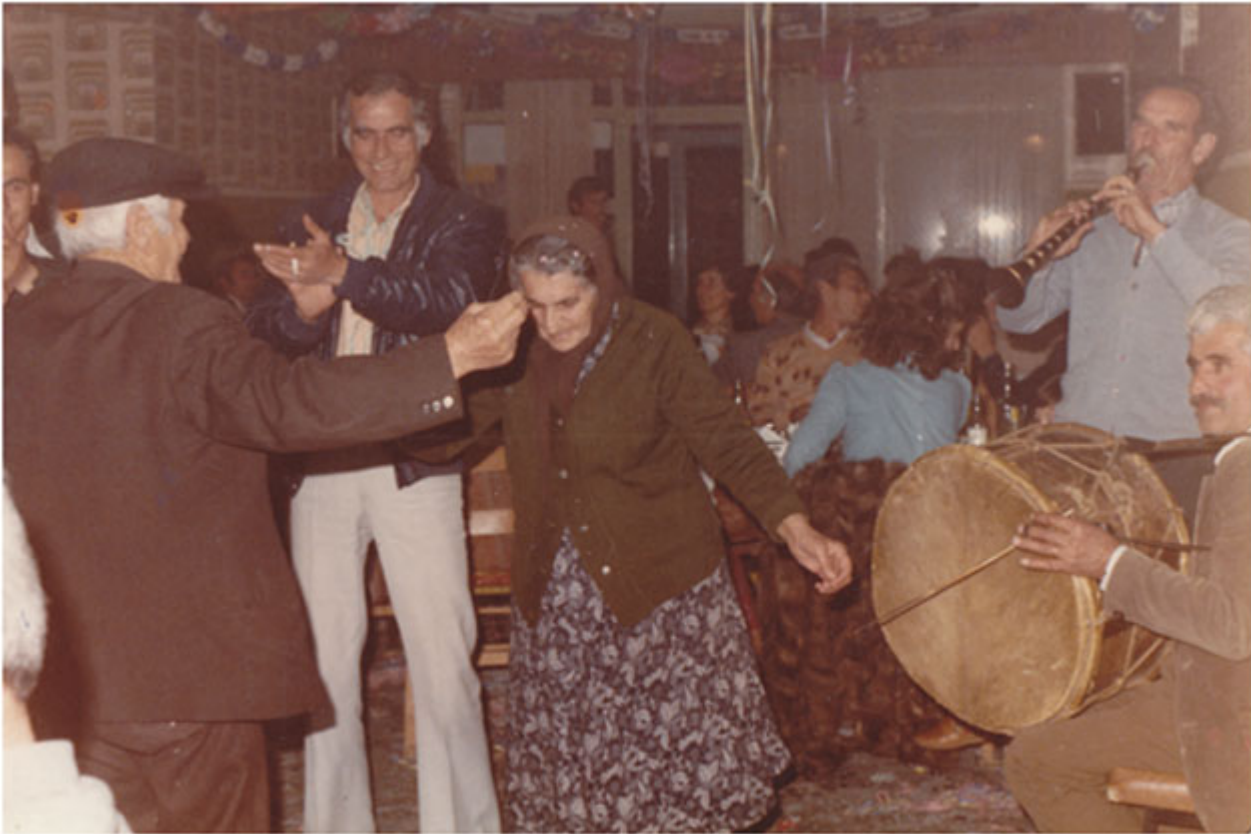
Εικ. 4: Αποκριάτικο γλέντι στο Νέο Κεραμύδι Πιερίας (Εζενούς Έρμπαας) με ζουρνά και νταούλι από τη Σεβαστή Πιερίας (Άργος Νεοκαισάρειας).

Τρίτη κατηγορία αποτελούν οι ποντιόφωνες αγροτικές κοινότητες μέσα στο σαντζάκι της Τοκάτης, όπως το Εϊρέπ (Eyrer) (Εικ. 3), με το οποίο ασχολήθηκε η έρευνα του ΚΕΠΕΜ. Τα ποντιόφωνα χωριά της περιοχής δημιουργήθηκαν μέσα στον 19 ο αιώνα από μετοικήσεις χριστιανικών πληθυσμών με προέλευση κυρίως τις περιφέρειες Αργυρούπολης και Νικόπολης του Ανατολικού Πόντου. Κύρια αιτία για τις μετοικήσεις αυτές στάθηκε η παρακμή των μεταλλείων που λειτουργούσαν στις προαναφερθείσες περιφέρειες. Οι πληθυσμοί αυτοί έφεραν μαζί τους τον δικό τους πολιτισμό, όμως, από ό,τι φαίνεται, γρήγορα αφομοίωσαν στοιχεία που βρήκαν στον τόπο εγκατάστασης. Από μουσικοχορευτικής πλευράς, η ζυγιά που παιζόταν στο Εϊρέπ ήταν ο ζουρνάς και το νταούλι, ενώ η μουσικοχορευτική παράδοση του χωριού ανήκει και αυτή φανερά στον κορμό της ποντιακής παράδοσης.