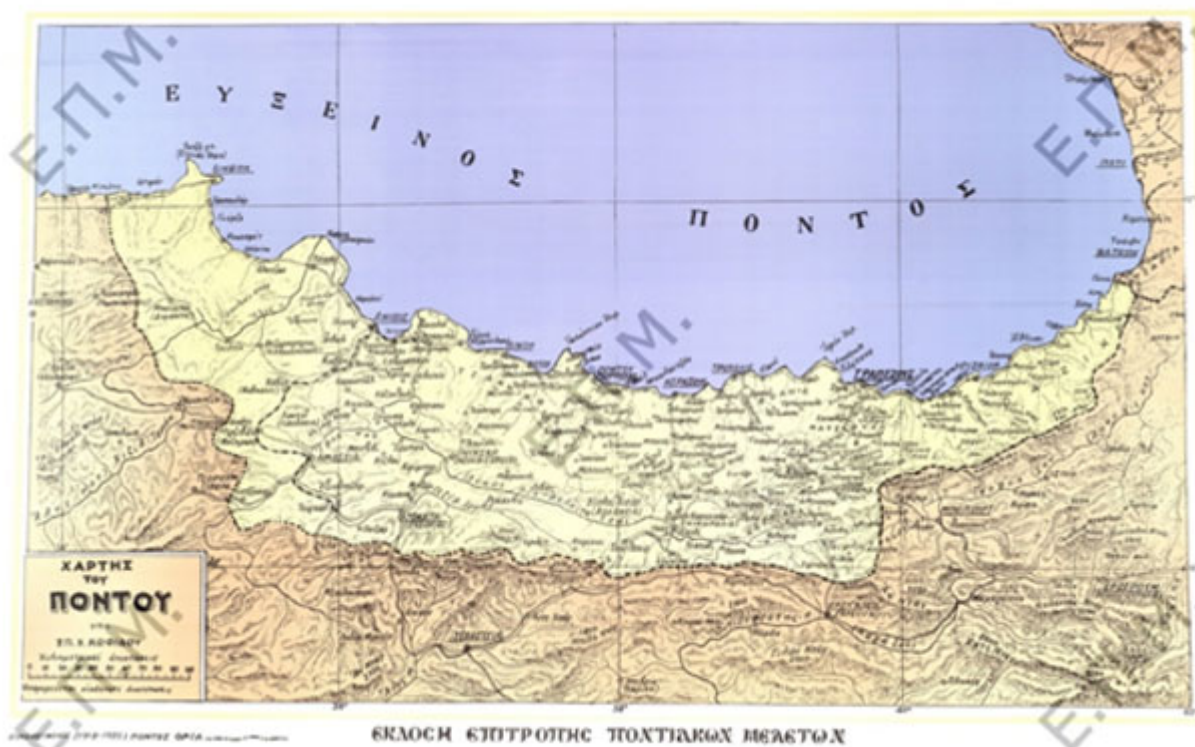
Εικ. 1: Χάρτης με τα όρια του διεκδικούμενου μεταξύ 1918 και 1922 ποντιακού κράτους (Έκδοση Επιτροπής Ποντιακών Μελετών).

Ο Πόντος, ως γεωγραφικός όρος, έχει καθιερωθεί να προσδιορίζει τα νοτιοανατολικά παράλια του Ευξείνου Πόντου. Άκρο προς τη Δύση θεωρείται η περιφέρεια της Σινώπης, το ανατολικό του σύνορο τοποθετείται λίγα χιλιόμετρα πριν το Βατούμ της σημερινής Γεωργίας, ενώ τα νότια σύνορά του περνούν νότια των πόλεων Αμάσεια, Τοκάτη, Νικόπολη και Αργυρούπολη. Η οριοθέτηση αυτή δεν είναι τίποτα άλλο από τα σύνορα που χαράχθηκαν στον χάρτη στις αρχές του 20 ού αιώνα, για να περιλάβουν το διεκδικούμενο μεταξύ 1918 και 1922 ανεξάρτητο ποντιακό κράτος στην περιοχή (Εικ. 1). Είναι προφανές ότι τα σύνορα αυτά (όπως και κάθε άλλωστε πολιτικό σύνορο) δεν συνιστούν και πολιτισμικό όριο. Εκτός των συνόρων λοιπόν αυτών, τόσο νότια όσο και δυτικά, κατοικούσαν χριστιανικοί πληθυσμοί, που αποτελούσαν φυσιολογικά την πολιτισμική συνέχεια των εντός των συνόρων χριστιανικών πληθυσμών. Ερευνώντας επομένως τον πολιτισμό των χριστιανικών πληθυσμών της περιοχής, είναι σωστό να δούμε την περιοχή χωρίς σύνορα, μέσα στον ενιαίο ευρύτερο χώρο της, όπου τα πολιτισμικά δεδομένα ορίζονται περισσότερο από τα κέντρα έλξης και επιρροής (αστικά κέντρα), και τα γεωφυσικά, γεωγραφικά, κοινωνικοοικονομικά και εθνολογικά δεδομένα της περιοχής.