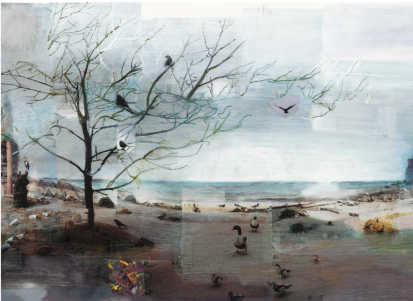
Έργο της Μαρίνας Καρέλλα

Η έκθεση, που παρουσιάζεται στην περίοδο ξηρασίας του ελληνικού καλοκαιριού, θέτει ως στόχο επίσης να ενθαρρύνει, μέσω της τέχνης, το διάλογο για τις πηγές και τις χρήσεις του γλυκού νερού και να ευαισθητοποιήσει το κοινό για την ορθότερη διαχείριση του νερού.